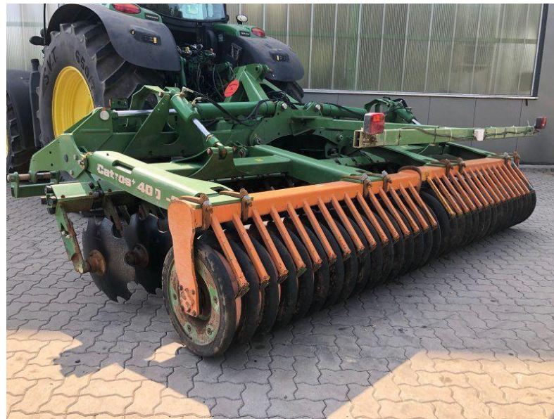
VALTRA CATROS 4001-2