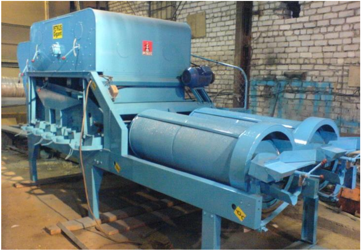
Пектус - Гигант