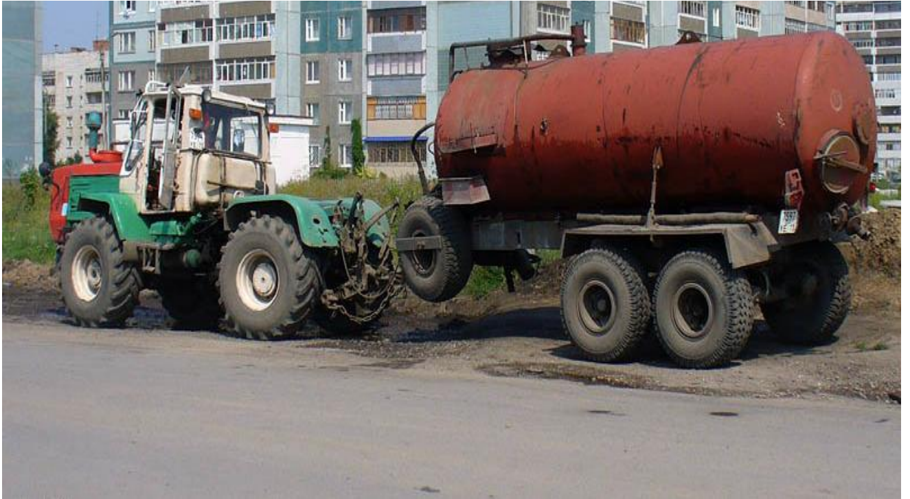
T-150 + МЖТ