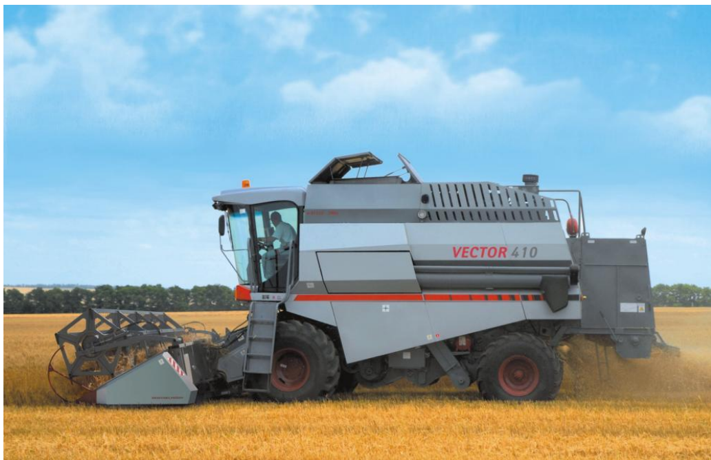
VECTOR - 410