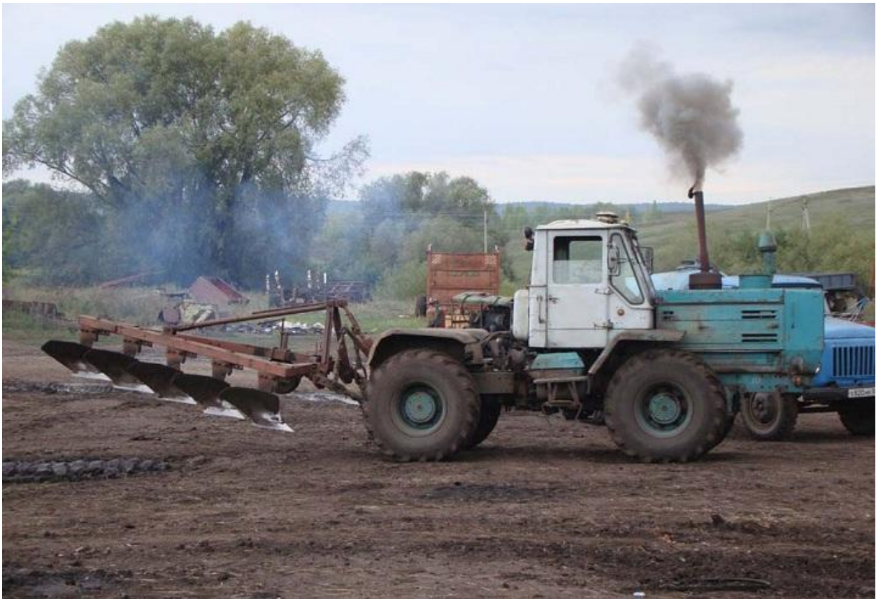
Т-150 ПЛН 5-35