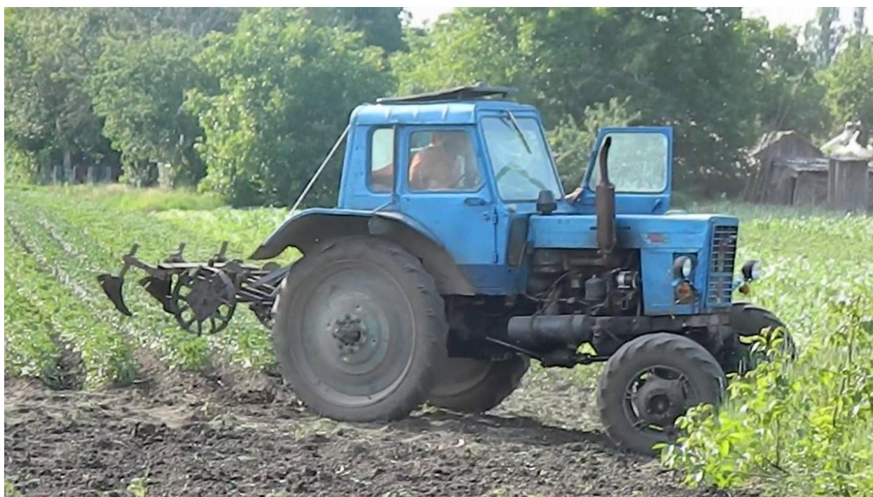
MT3-82 + КОН-2.8