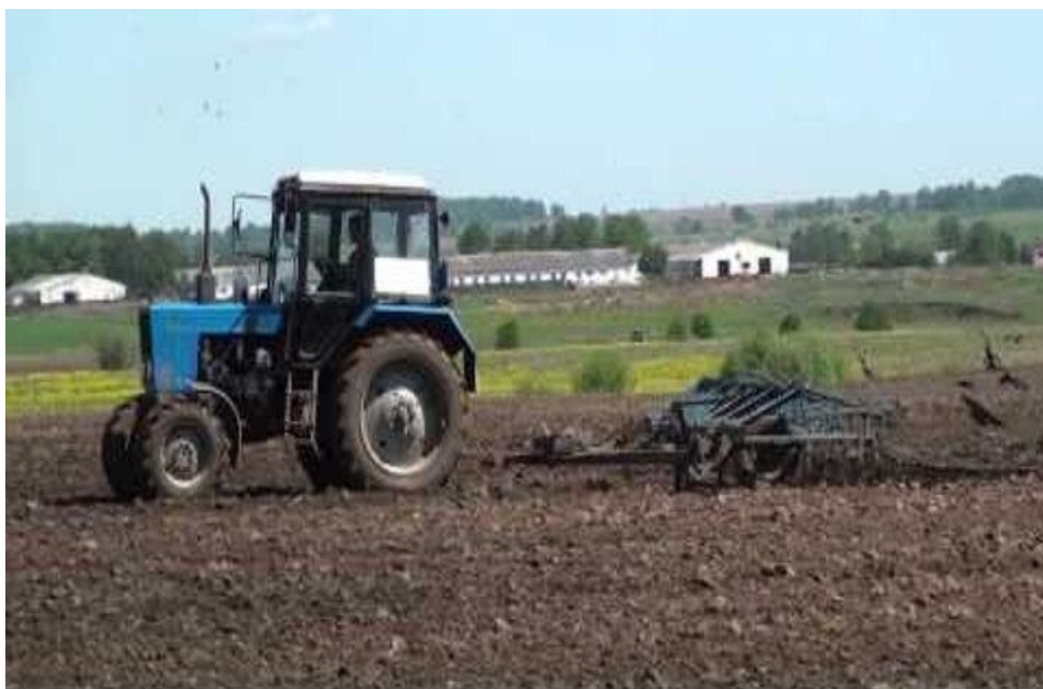
MT3-82 + КПС-4