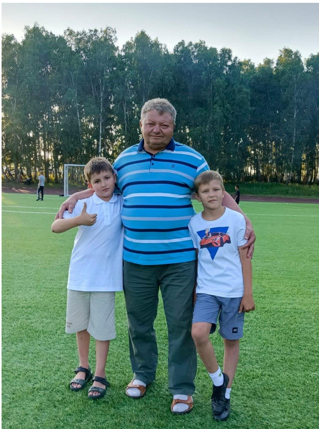
С внуками Это мои продолжатели, моя надежда, моя гордость