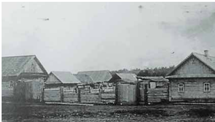
Участок Андрюшинский. Начало XX века

Участок Андрюшинский заселяли переселенцы с Гродненской губернии, Пружанского, Слонимского, Кобринского, Брестских уездов и Витебской губернии Белоруссии. Были также и с Украины, Молдавии, западных частей России.