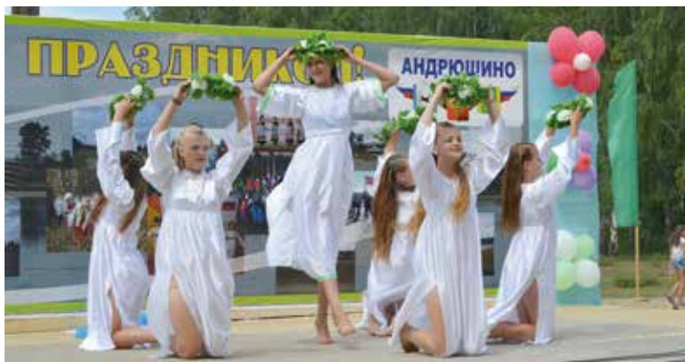
Андрюшино 115 лет. Хореографическая группа «Чаборок»