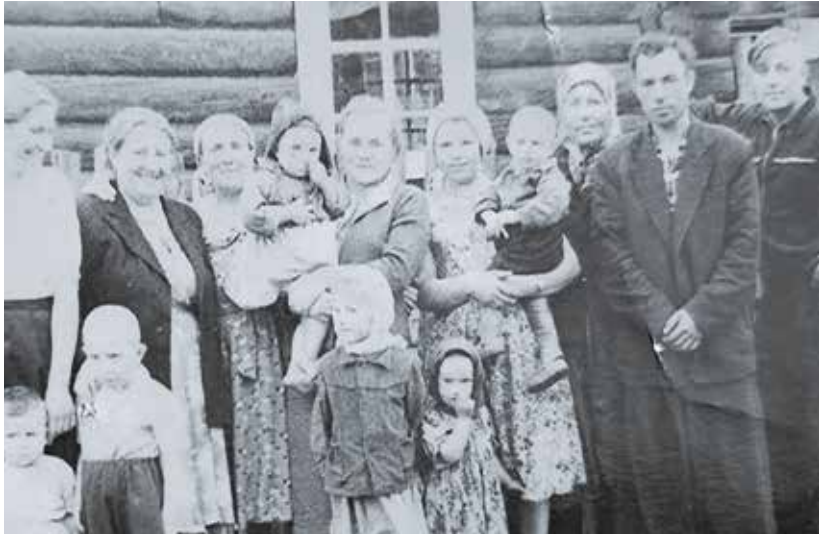
Жители улицы Набережная, 1950 годы

Была своя вальцовая мельница и на трудодни выдавали муку семьям.