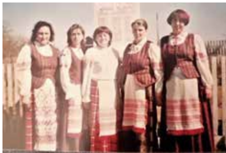
Фольклорный ансамбль «Сунички», первый состав