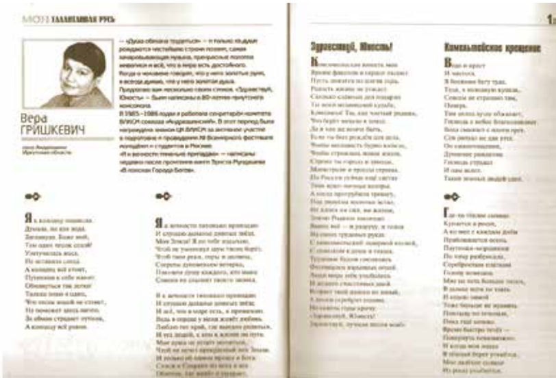
Альманах «Моя талантливая Русь» № 1. 2010 г.