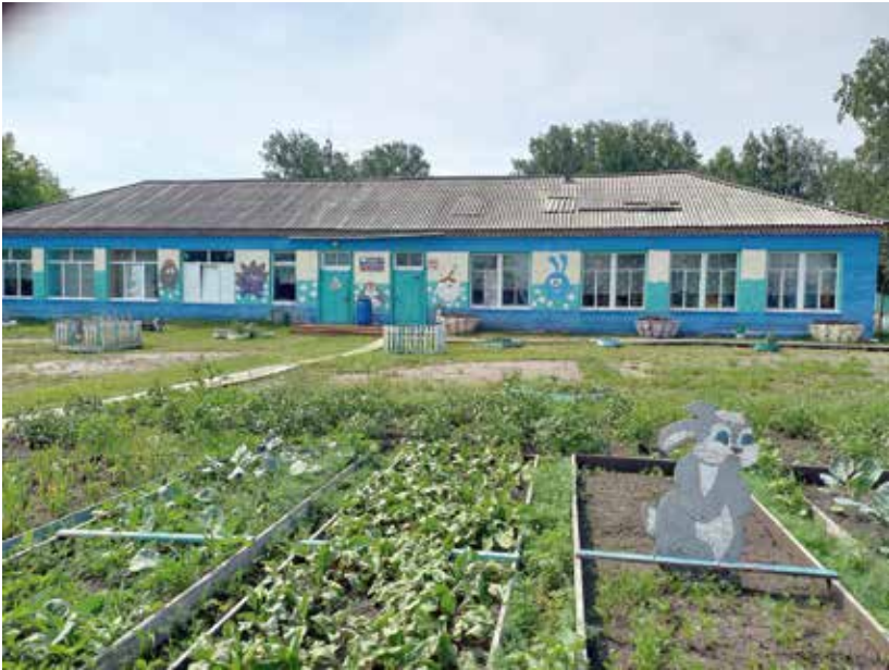
Нынешнее здание детского сада построено в 1978 году