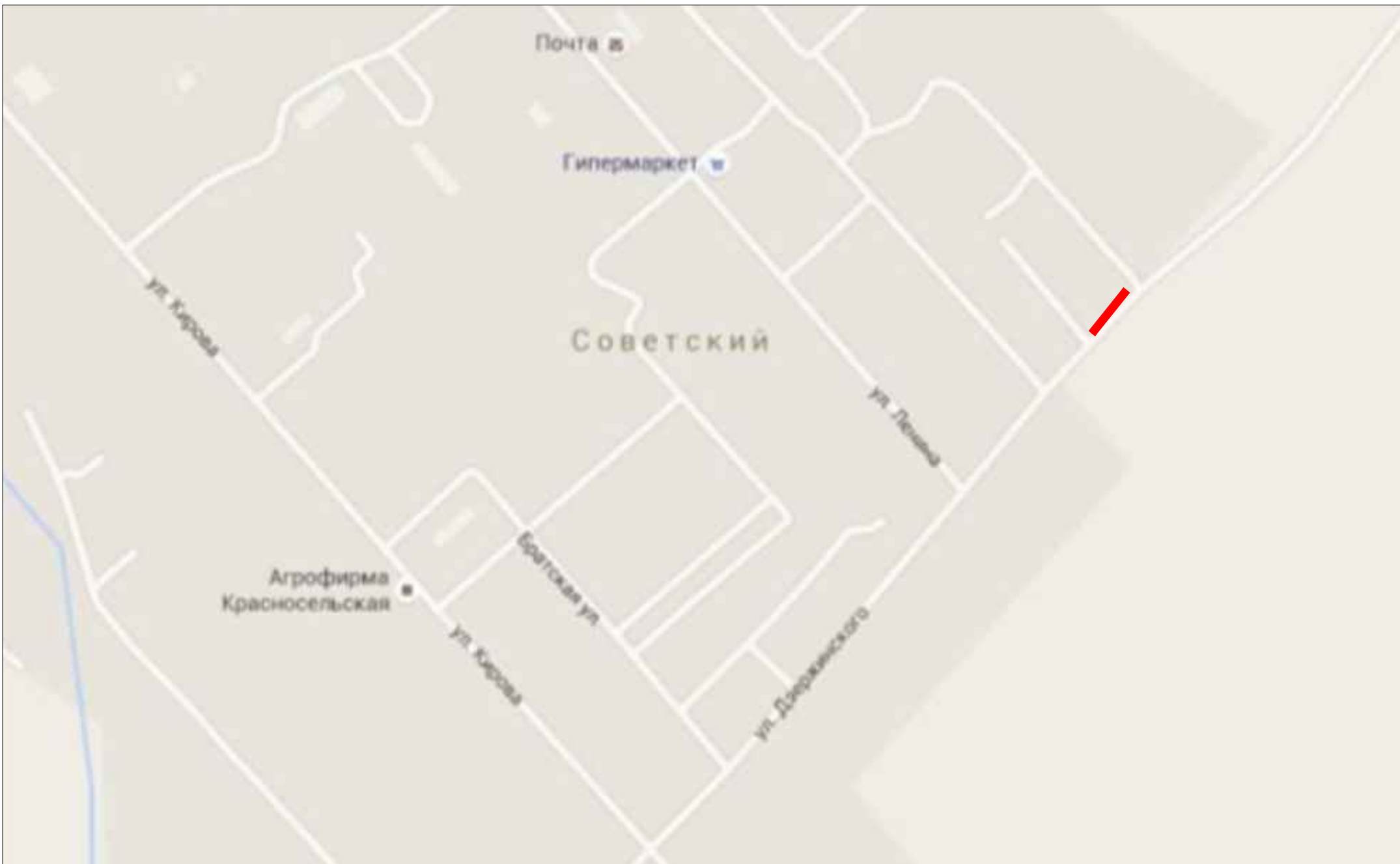
Схема расположения элемента планировочной структуры