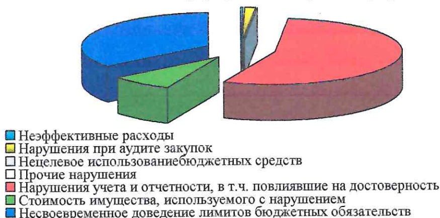
Виды нарушений, выявленные в 2020 году при проведении контрольных мероприятий

При сравнительном анализе данных по видам нарушений при проведении контрольных мероприятий в 2020 году установлено следующее: