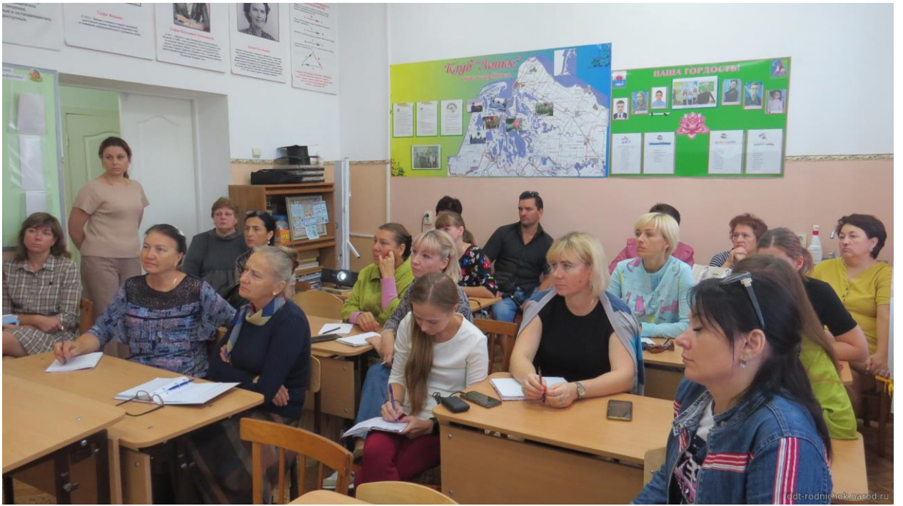
Рис 20. Семинар