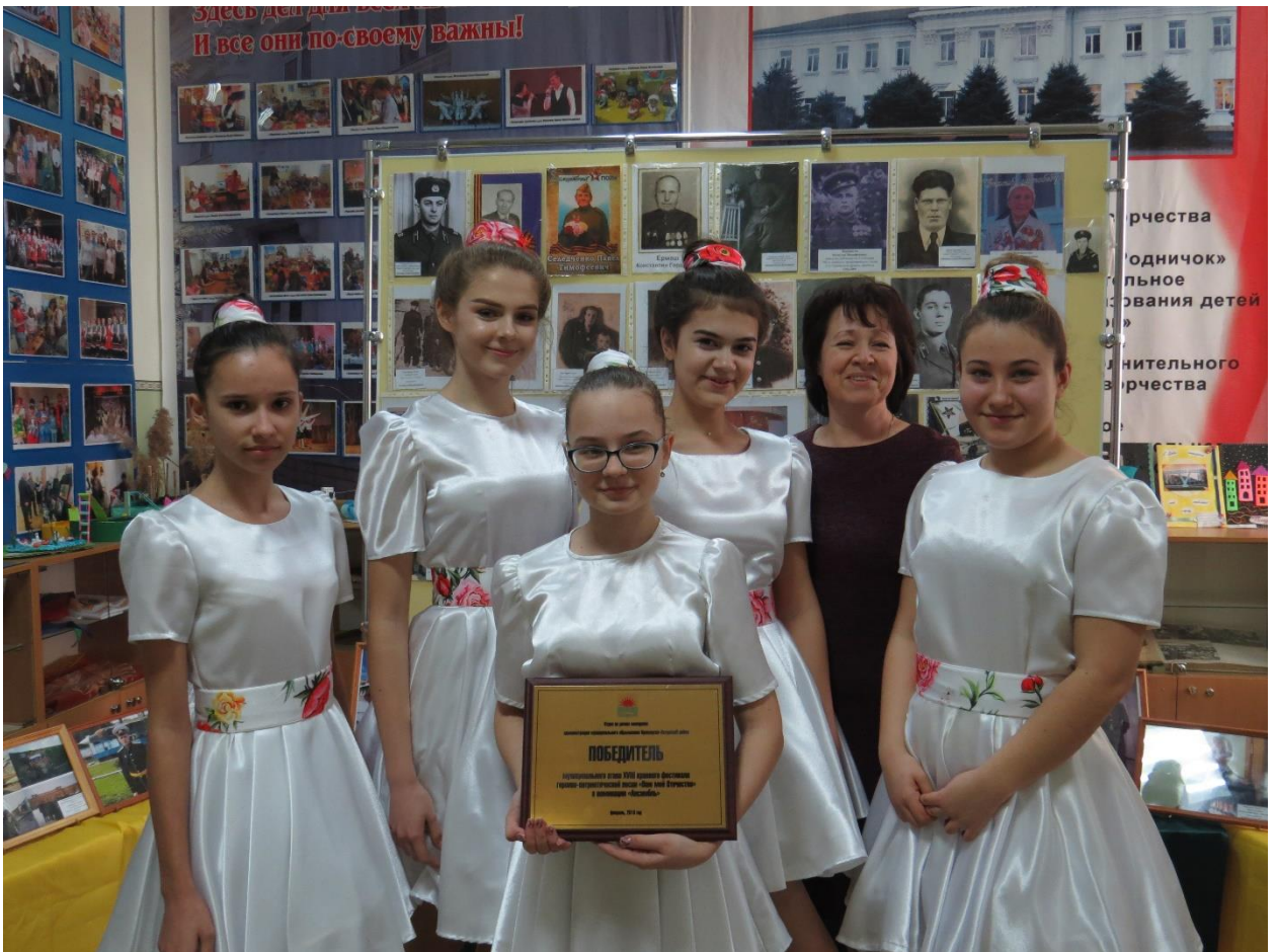
Рис4. Ансамбль эстрадной песни «Созвездие талантов»