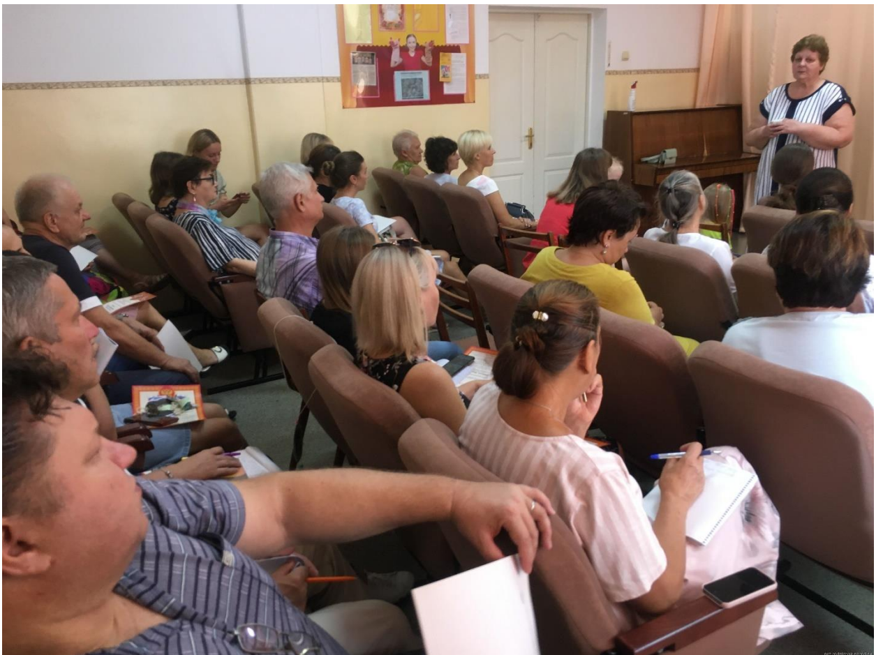
Рис2. Педагогический совет