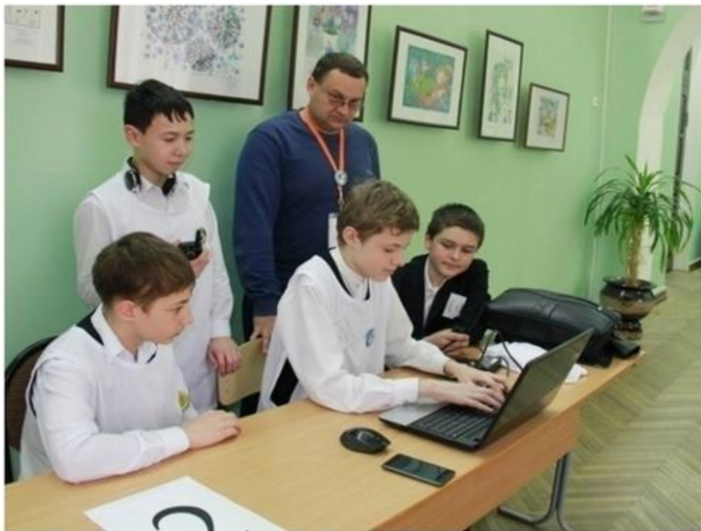
Рис 21. СЮТ на уроке