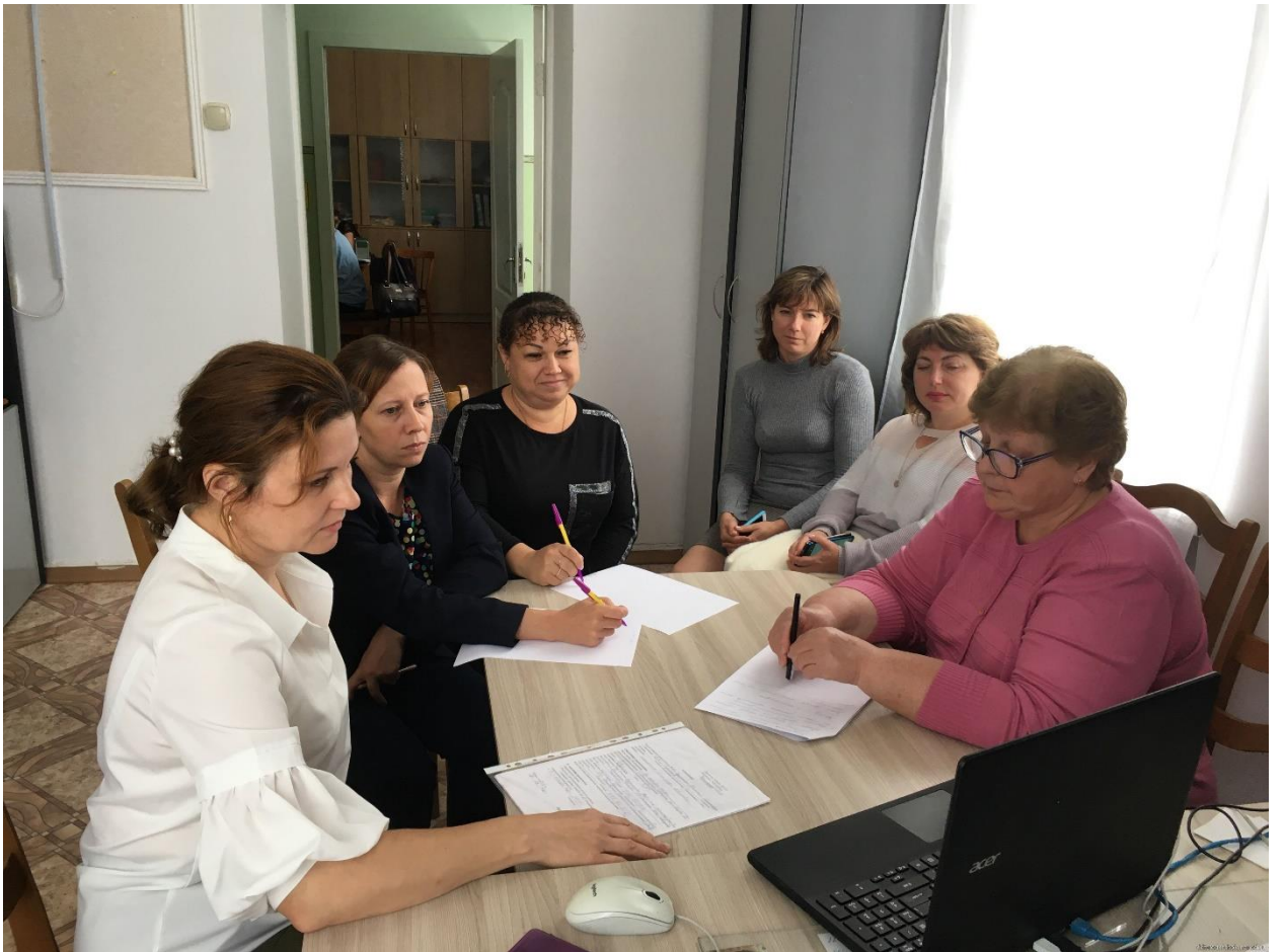
Рис 16. Планирование деятельности по реализации Целевой модели развития системы ДО