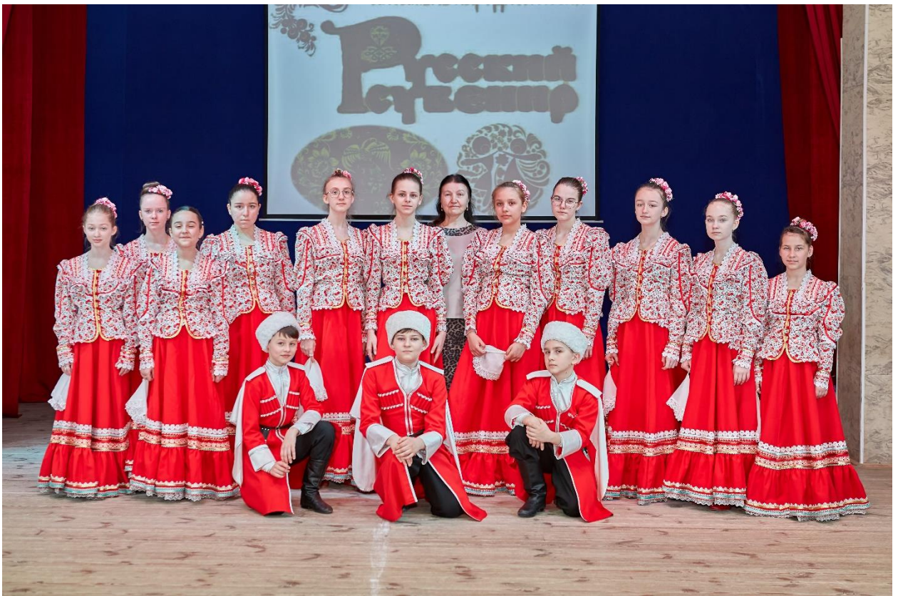
Рис3. Ансамбль народной песни «Русский сувенир»