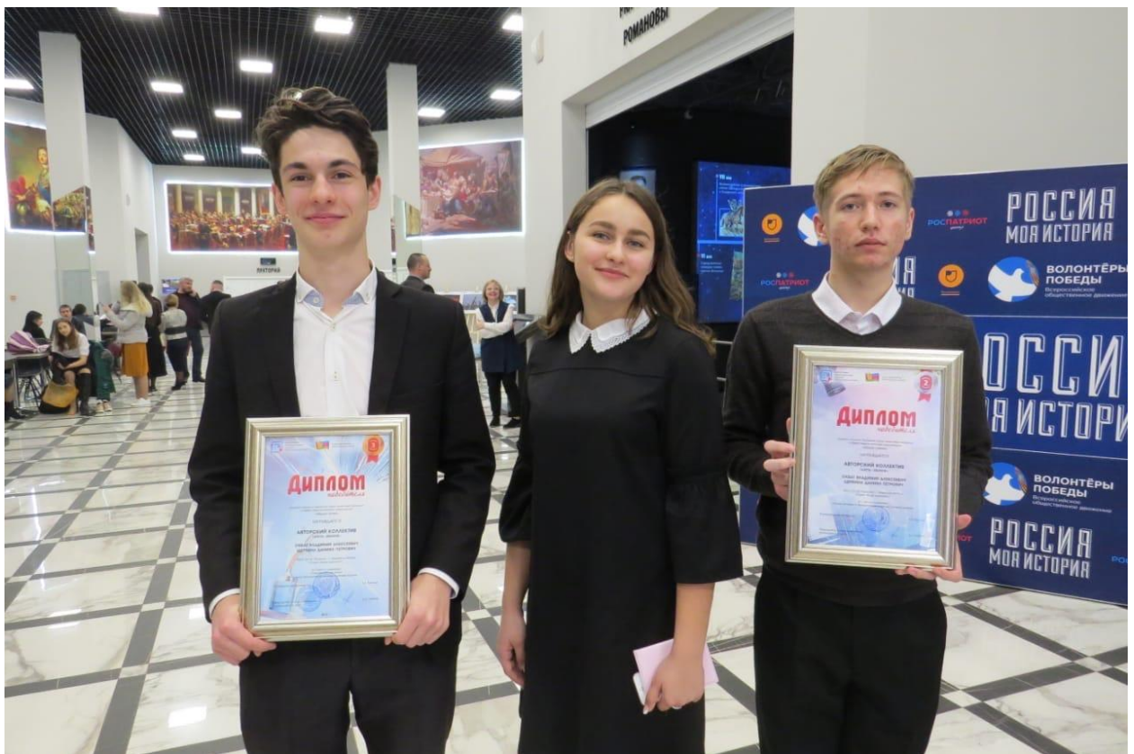
Рис 9. Журналисты