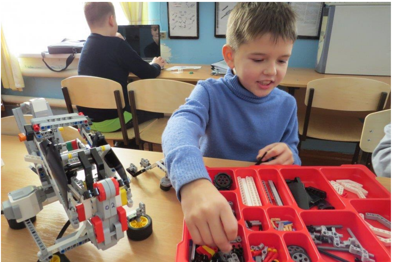
Рис 10. Интересные занятия СЮТ