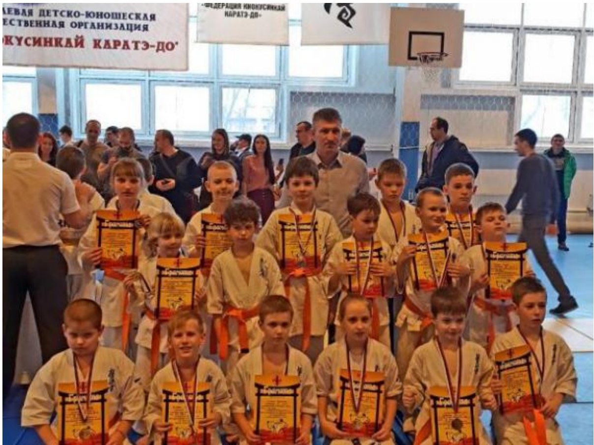
Рис 8. ДЮСШ Победители