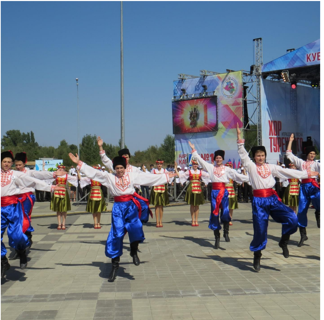
Рис 7. Выступление ансамбля Карусель в г. Краснодар