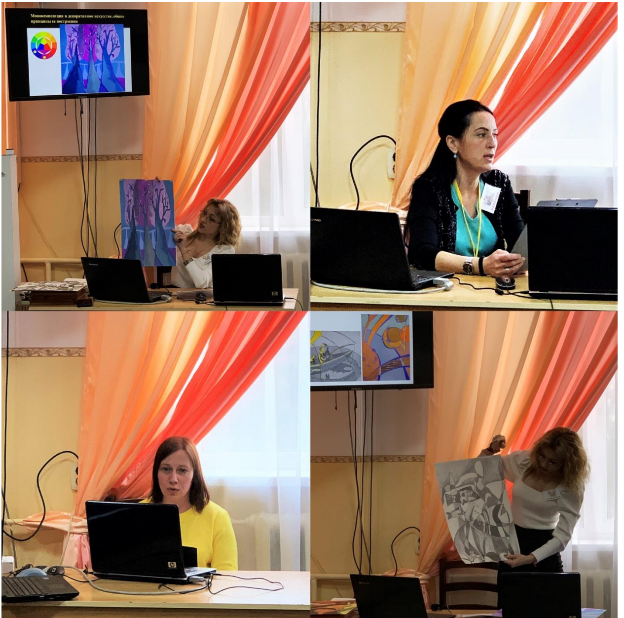
Рис 19. Семинар Нововведения в образовательном процессе