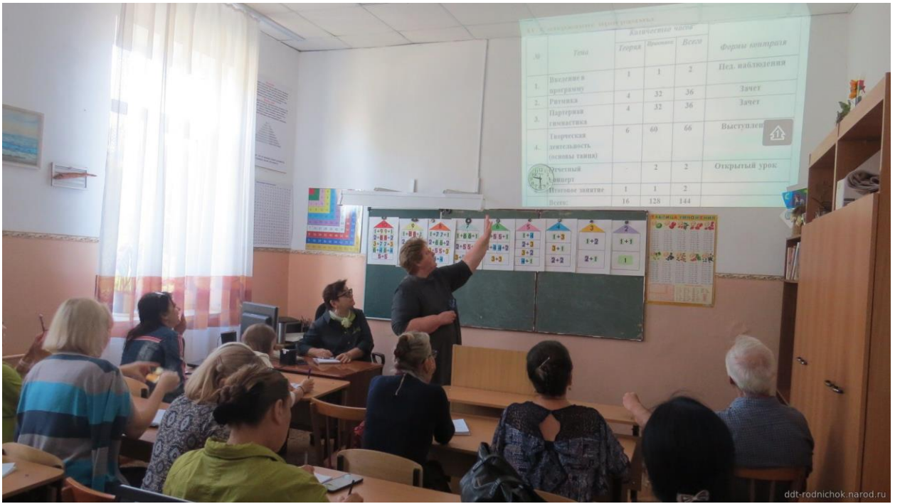
Рис1. Методический совет