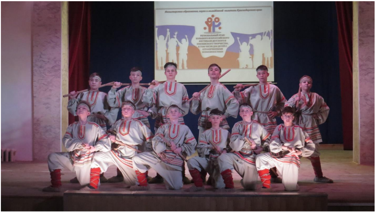
Рис 22. Хореографический ансамбль Карусель