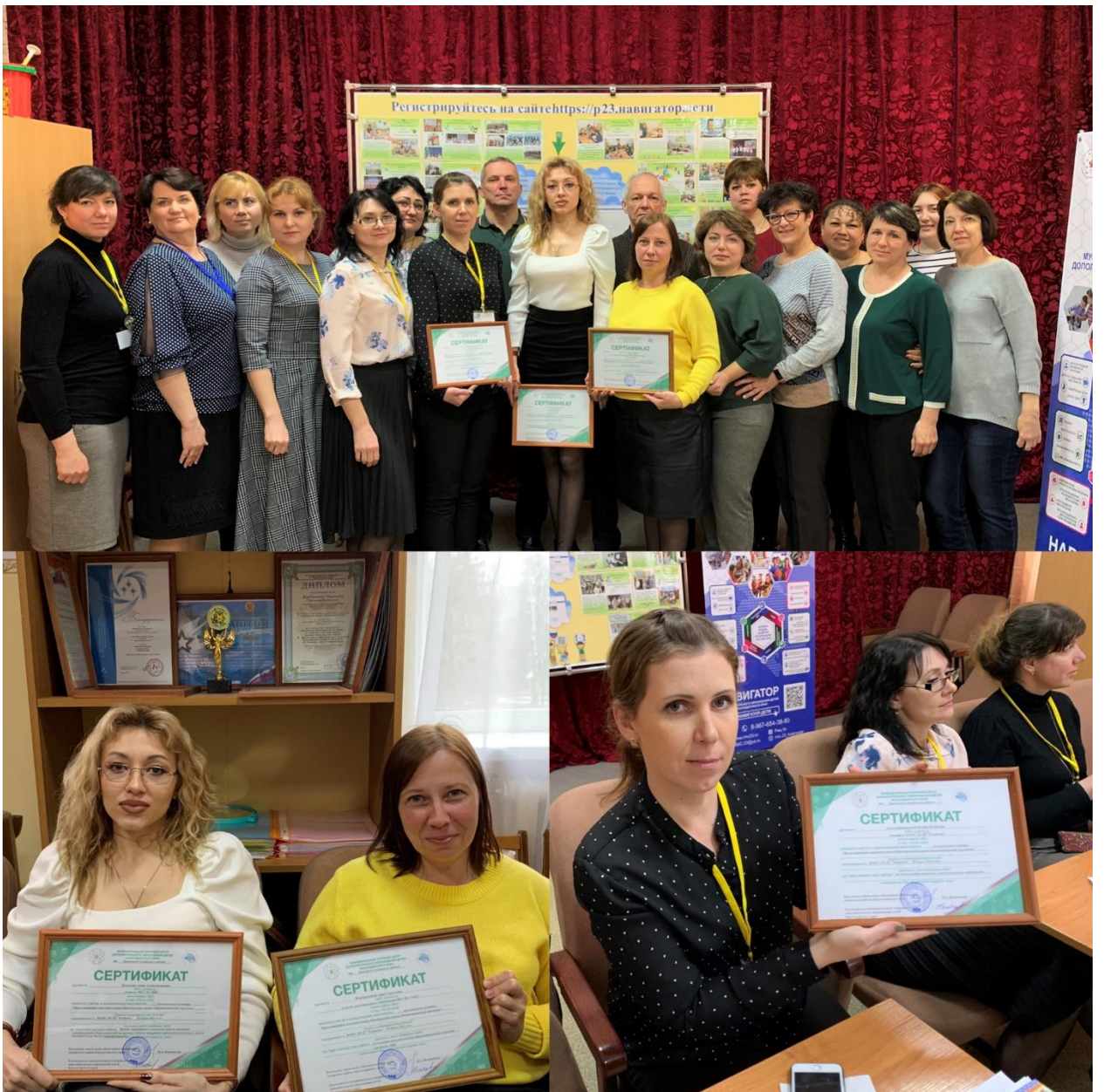
Рис 15. Методический семинар Проектирование ДОП программ