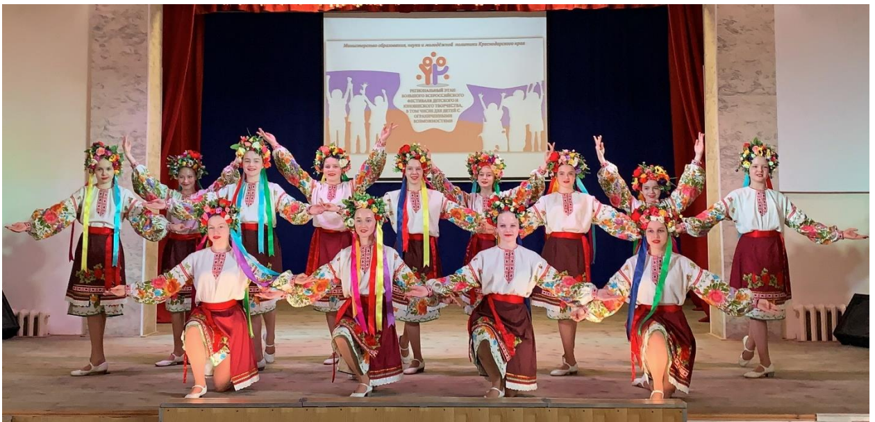
Рис 23. Хореографический ансамбль Сюрприз