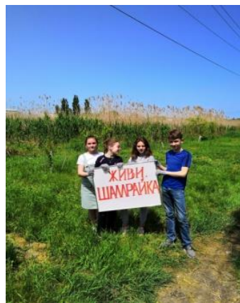
Рисунок 2-4 – проект будущего уголка природы на Шамрайке