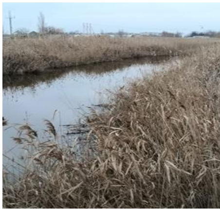
Рисунок 1- балка Шамрайка

Разрешите представиться: я - балка Шамрайка из города Приморско-Ахтарска. Протекаю в центре города, но в настоящее время нахожусь в печальном состоянии, может от того, что люди забыли мою историю.