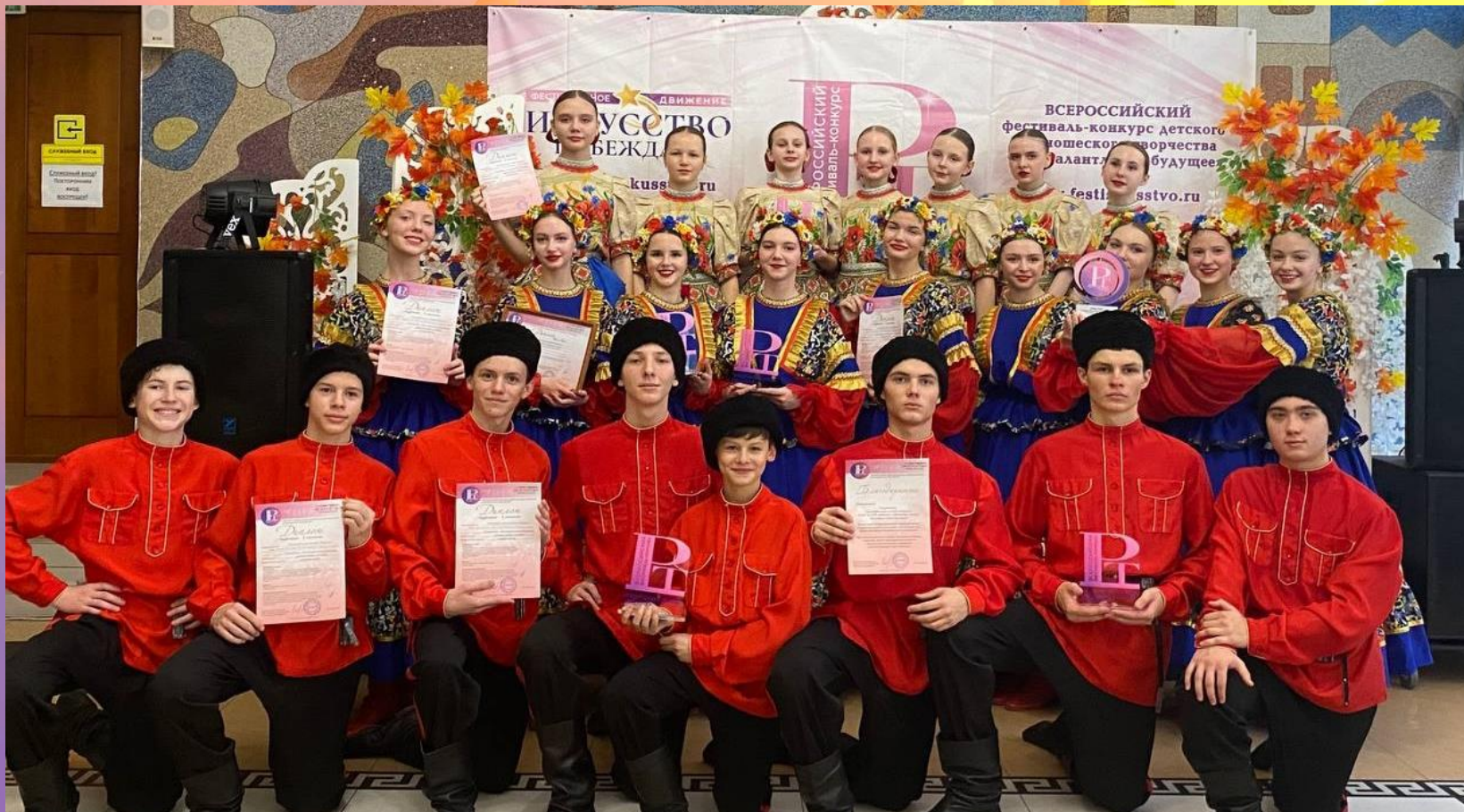
Хореографический ансамбль «Карусель» Гран-При, Лауреат 1 место (5 дипломов)