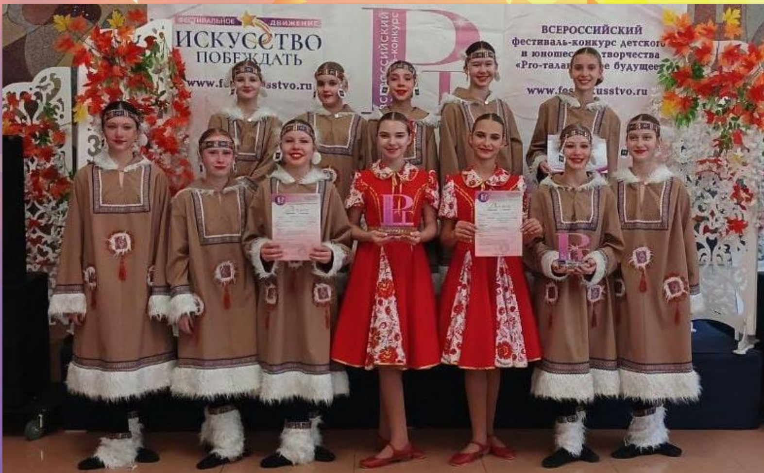
Хореографический ансамбль «Сюрприз» Лауреат 1 место (2 диплома)