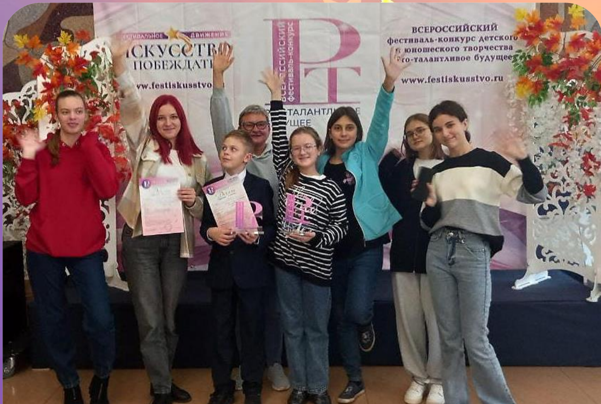
Театр – студия «Маскарад» Лауреат 1 степени