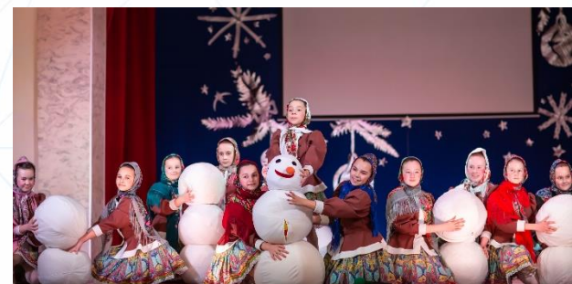
Победитель Международного конкурса « Под парусом творчества »