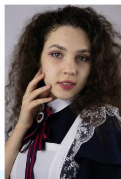
Победитель Международного конкурса научно- исследовательских и творческих работ учащихся « Старт в науке »