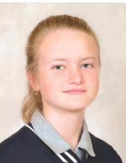
Победитель Международного конкурса научно- технологических и социальных предпринимателей « Молодежь. Наука. Бизнес »