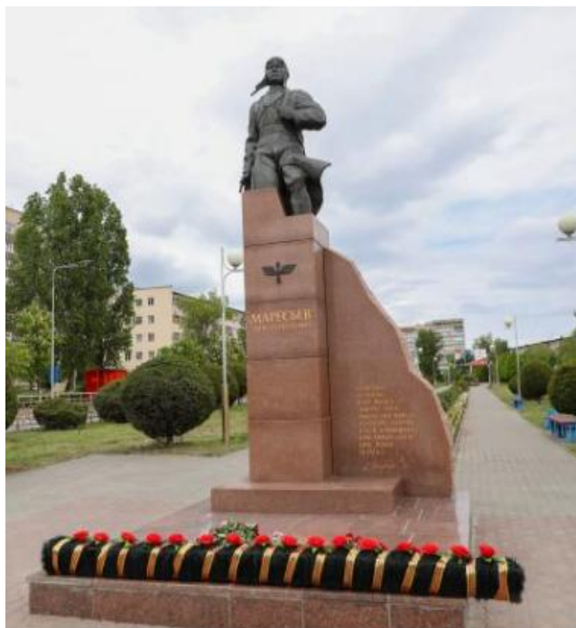
Памятник А. П. Маресьеву в Камышине