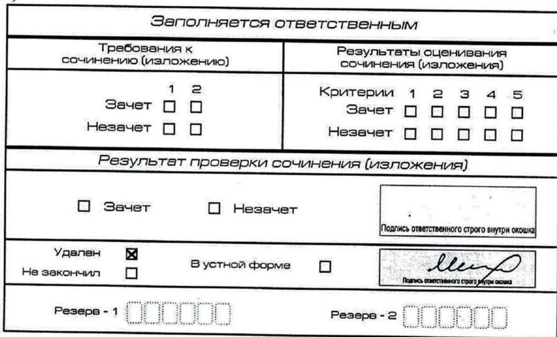
Рис. 13. Заполнение полей нижней части бланка регистрации (удаление с экзамена)

подписью члена комиссии по проведению итогового сочинения (изложения) (см. рис. 13).