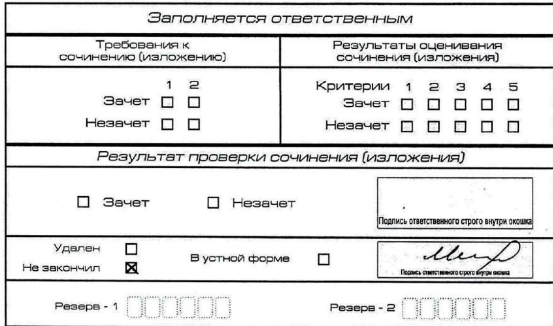
Рис. 12. Заполнение полей нижней части бланка регистрации (участник не закончил написание сочинения (изложения) по уважительным причинам)

поставить свою подпись в указанной форме). В бланке регистрации указанного участника итогового сочинения (изложения) необходимо внести отметку «X» в поле «Не закончил» для учета при организации проверки, а также для последующего допуска указанных участников к повторной сдаче итогового сочинения (изложения) в дополнительные сроки. Внесение отметки в поле «Не закончил» подтверждается подписью члена комиссии по проведению итогового сочинения (изложения) (см. рис. 12).