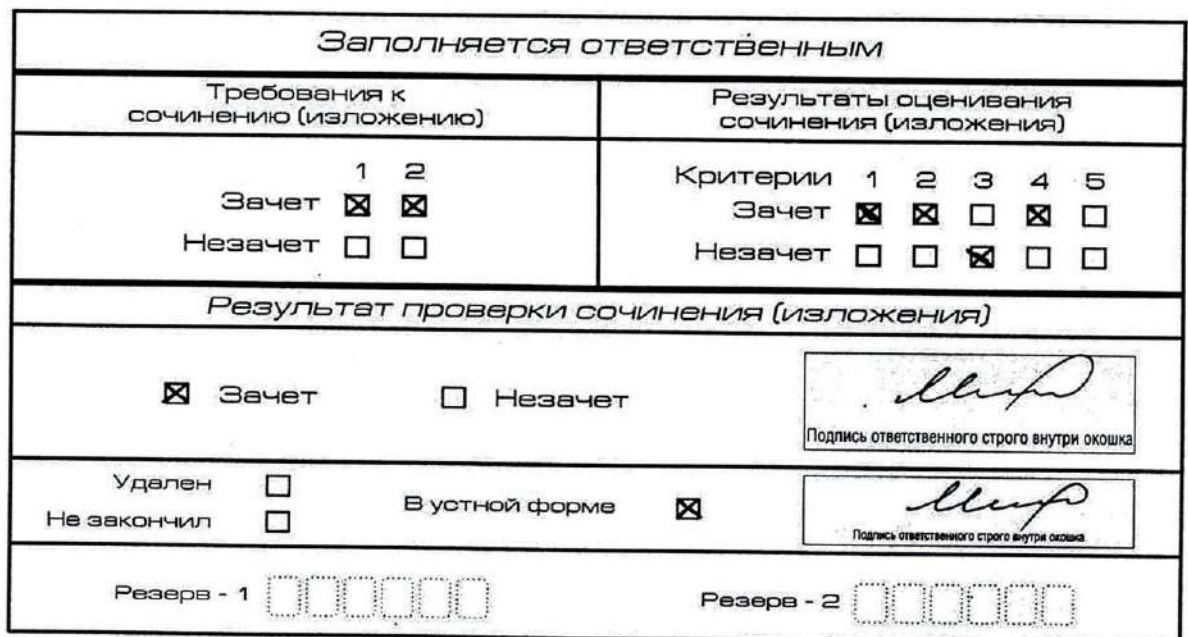
Рис. 11. Область для оценки работы сочинения (изложения) в устной форме

36. После окончания заполнения бланка регистрации ответственное лицо ставит свою подпись в специально отведенном для этого поле.