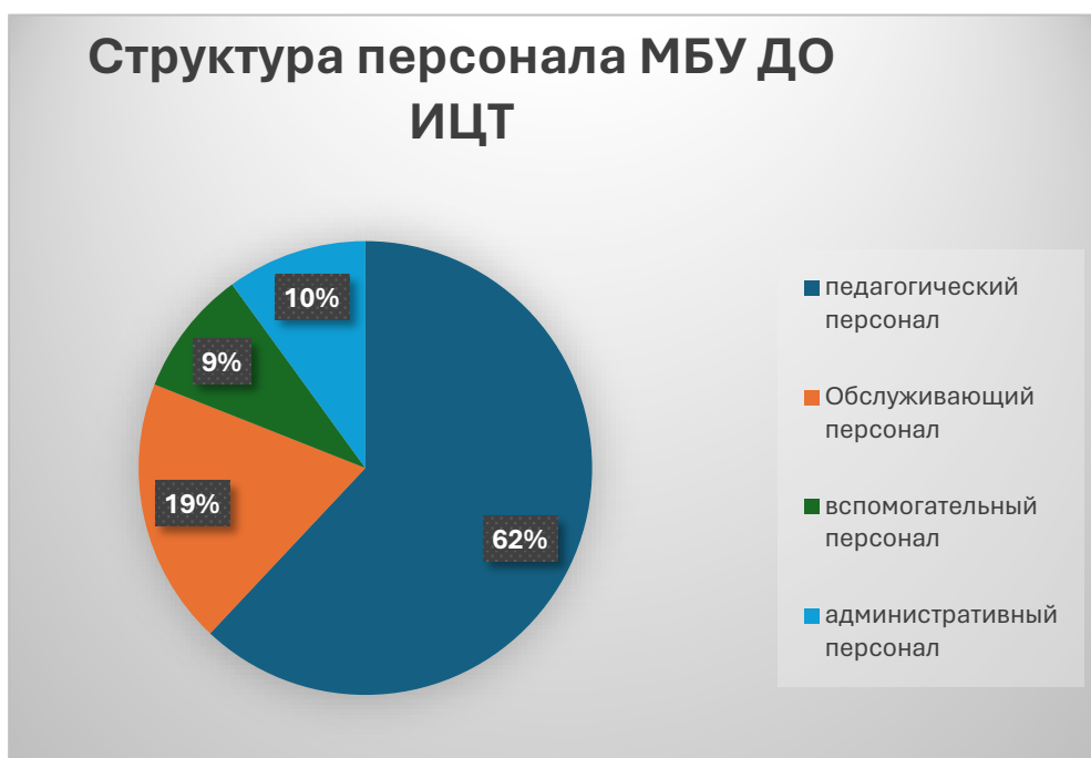
СХЕМА 2. Соотношение педагогического персонала к административно-управленческому

Соотношение составляет 62% / 38% , что соответствует норме