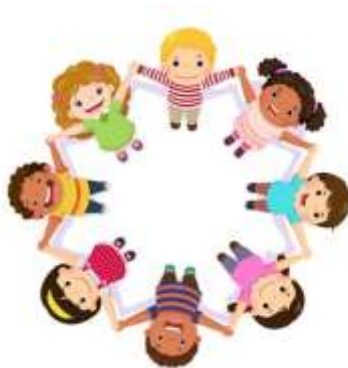
Рис.2. - Игра «Пузырь»

В настоящее время в рамках реализации ФГОС ДО особое внимание уделяла вопросу оздоровления детей. Для сохранения и укрепления физического и психического здоровья детей дошкольного возраста использовала дыхательные упражнения, развитию которых служат такие дидактические игры как, например, «Пузырь». Играющие строятся в круг и раздувают «пузырь» - наклонив голову вниз, дуют в кулачки, составленные трубочкой (один на один). При каждом раздувании все наклоняются вниз, выпускают воздух, затем, выпрямляются, набирают воздух, а потом, вновь наклонившись, произносят «ффф», выдувая в свою трубу. И так повторяется 2-3 раза.