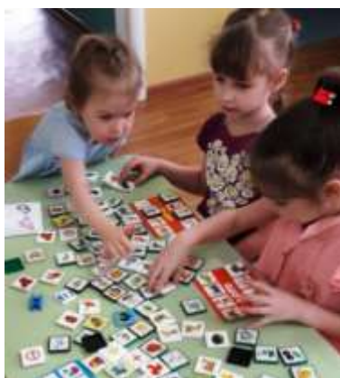
Рис.3. - Настольно-печатные игры

Настольно - печатные игры – это интересное занятие для детей при ознакомлении с окружающим миром. Они бывают разных видов: «лото», «домино», «парные картинки». Настольно-печатные игры успешно развивают речевые навыки, математические способности, логику, внимание, умение учиться моделировать жизненные ситуации и принимать решения, развивать навыки самоконтроля.