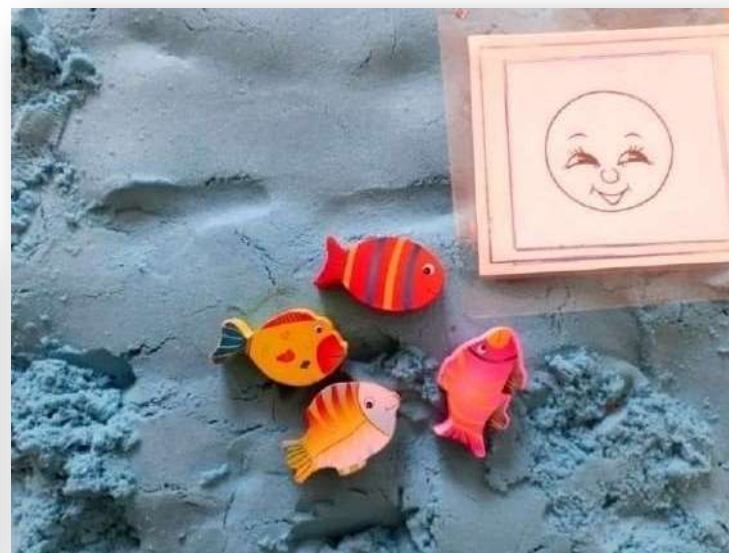
«Песочница с эмоциями»