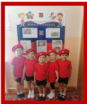
Программа работы клуба «Маленький юнармеец»