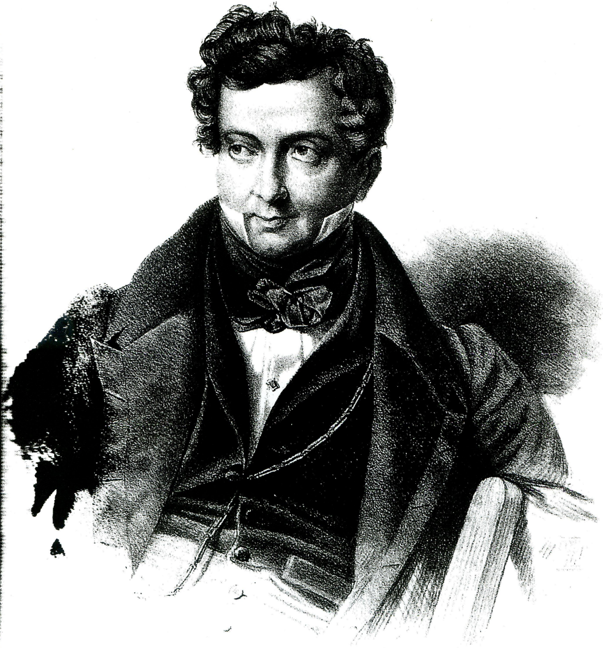
Михаил Юрьевич Виельгорский

М ихаил и Матвей были сыновьями перешедшего на русскую службу польского посланника при Екатерине II. Их отец, Илья Михайлович – музыкант, один из учредителей Петербургского филармонического общества. С отроческих лет братья Виельгорские играли в струнном квартете, вшиты в красоту музыки Гайдна, Мо-