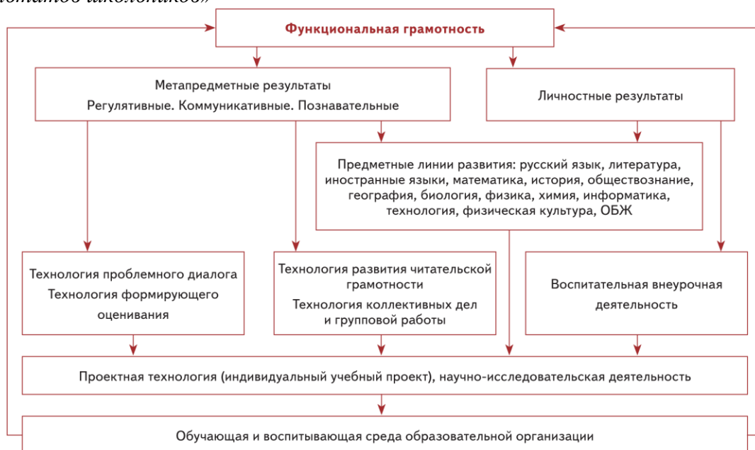
Схема «Система работы школы по обеспечению личностных и метапредметных (УУД) результатов школьников»

Для формирования функционально грамотной личности важнейшую роль играют не столько предметные результаты, сколько личностные и метапредметные результаты деятельности школьников. Это обеспечивается целостной системой работы с учениками как на уроках, так и вне учебного процесса.