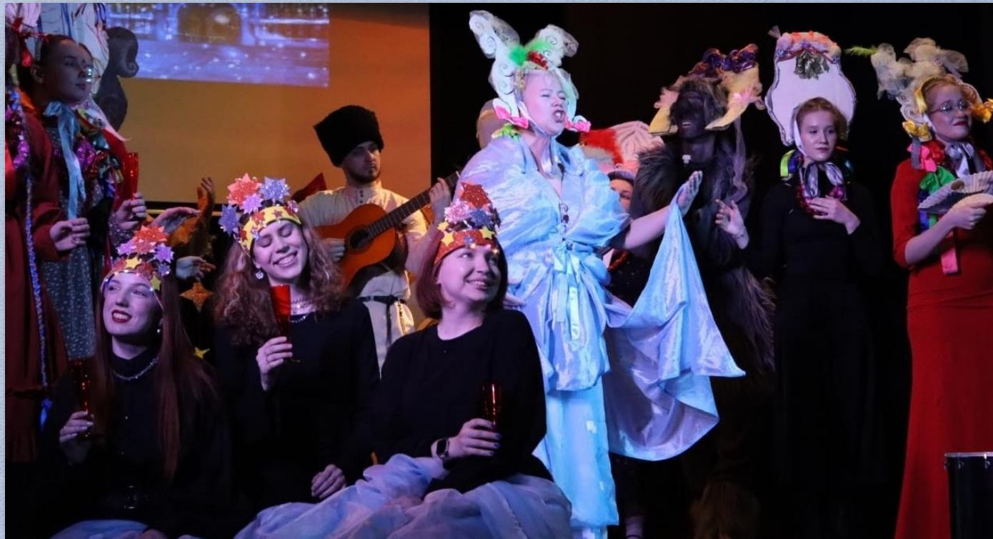
Межмуниципальный конкурс театральных творческих коллективов «Браво», приуроченный к 80-летию Победы в Великой Отечественной войне 1941-1945 годов (Норильск, 2025)