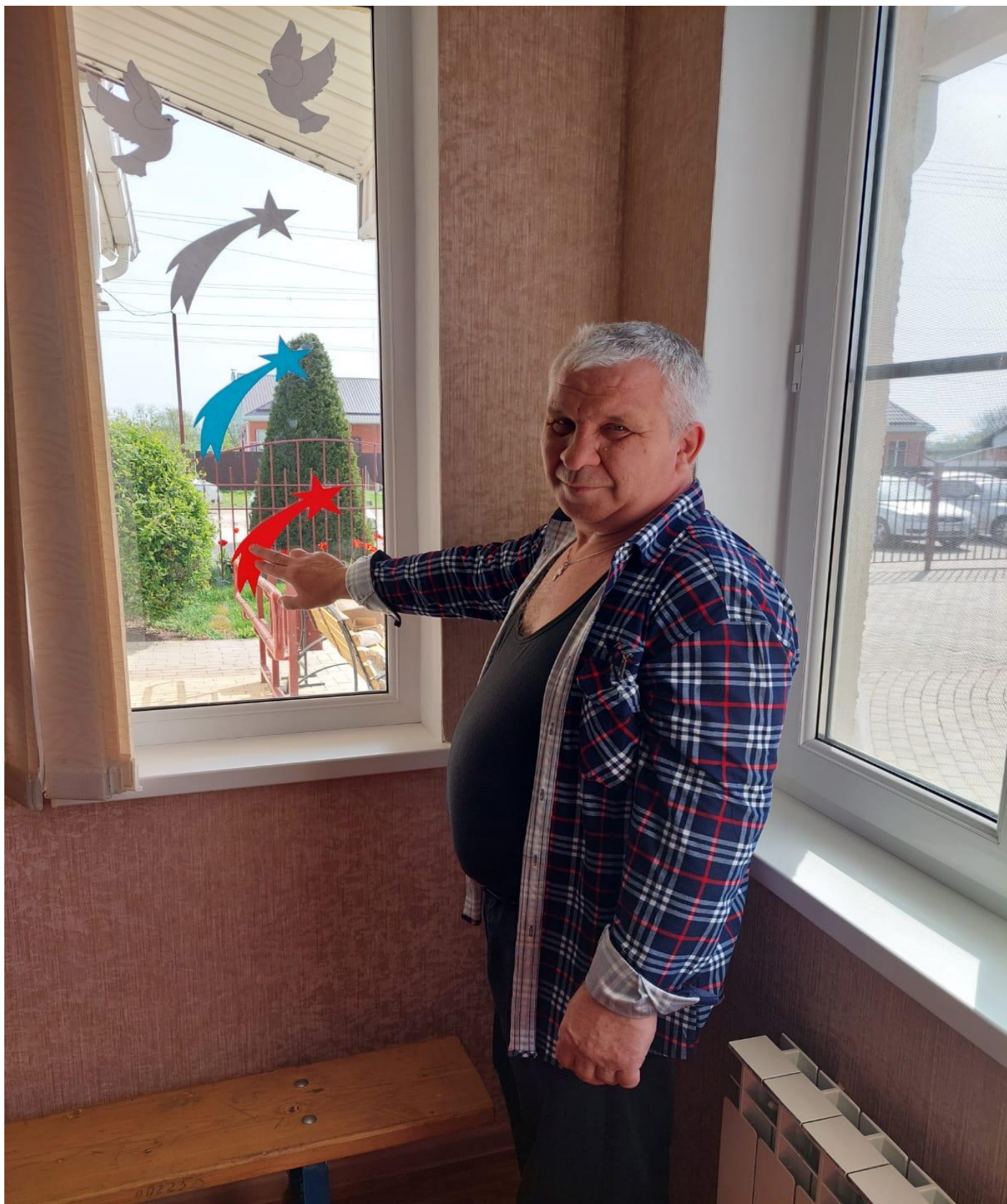
Культурный организатор отделения социальной реабилитации