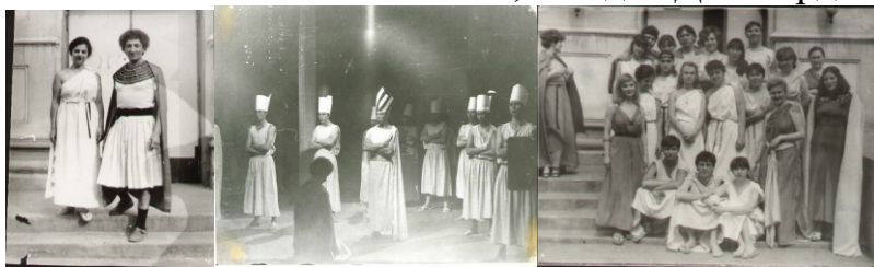
Постановка оперы Д.Верди "Аида" (1985)

Всего в течение последующих лет было поставлено тринадцать опер, среди которых: «Царская невеста» Н.Римского-Корсакова, «Иоланта» и «Мазепа» П.Чайковского, «Алеко» С.Рахманинова, «Лакме» Л.Делиба, «Сельская честь» П.Масканыи, «Аида» Дж. Верди.