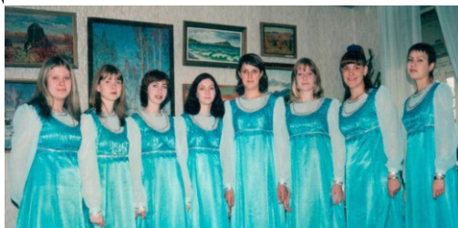
2002г. - Первый состав ансамбля «Дольче»

После того как Н.И.Лычева передала руководство хором колледжа молодым педагогам, в 1992 году она организовала на своем отделении вокальный ансамбль «Дольче».