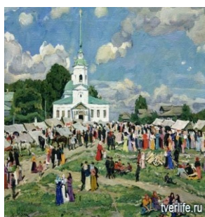
К.Юон -Сельский праздник. Тверская губерния. 1910 (село Петровское)