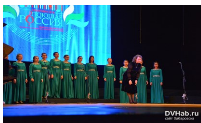
2018г.-выступление ансамбля "Дольче" на конкурсе "Поющая Россия"(Казань)

В 2021 году ансамбль "Дольче" стал лауреатом 1 степени городского хорового фестиваля "Дальневосточное бельканто", лауреатом 2 степени регионального этапа Всероссийского хорового фестиваля.