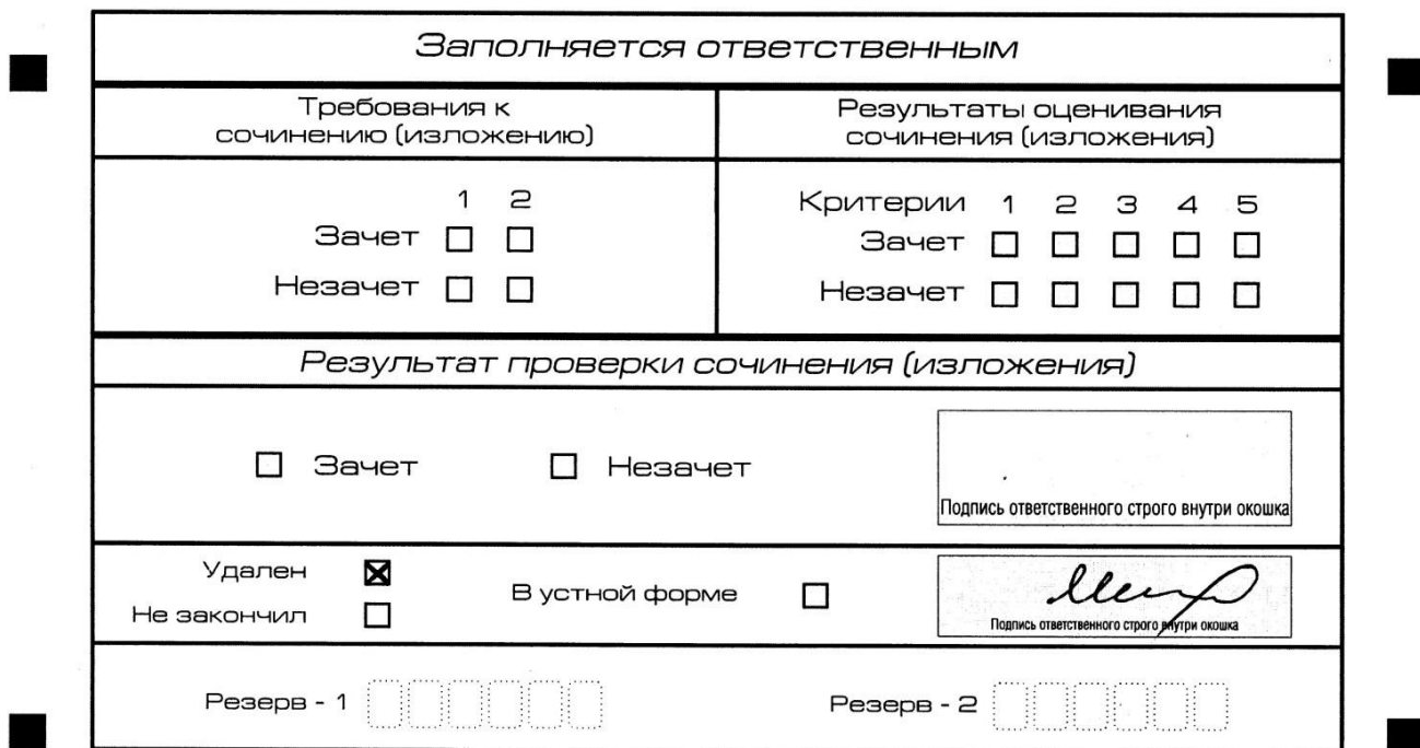
Рис. 13. Заполнение полей нижней части бланка регистрации (удаление с экзамена)

В случае если участник итогового сочинения (изложения) нарушил установленные требования, изложенные в пункте 27 Порядка проведения государственной итоговой аттестации по образовательным программам среднего общего образования (приказ Министерства просвещения Российской Федерации и Федеральной службы по надзору в сфере образования и науки от 07.11.2018 г. №190/1512), он удаляется с итогового сочинения (изложения). Член комиссии по проведению итогового сочинения (изложения) составляет «Акт об удалении участника итогового сочинения (изложения)» (форма ИС-09), вносит соответствующую отметку в форму ИС-05 «Ведомость проведения итогового сочинения (изложения) в учебном кабинете ОО (месте проведения)» (участник итогового сочинения (изложения) должен поставить свою подпись в указанной форме). В бланке регистрации указанного участника итогового сочинения (изложения) необходимо внести отметку «X» в поле «Удален». Внесение отметки в поле «Удален» подтверждается подписью члена комиссии по проведению итогового сочинения (изложения) (см. рис. 13).