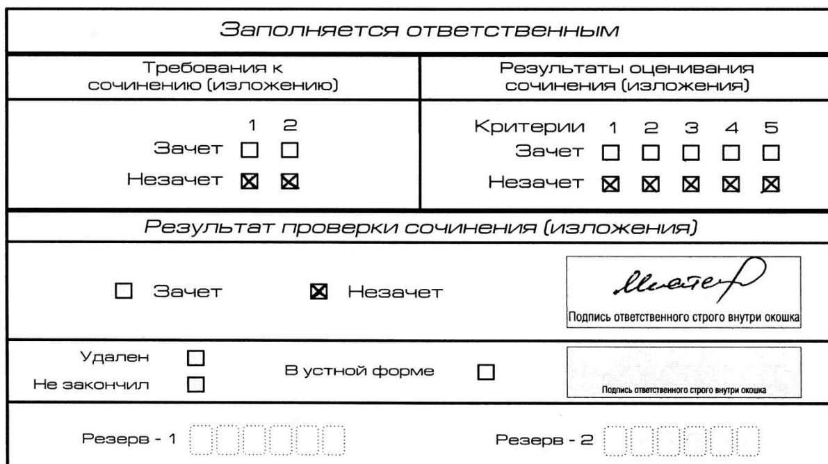
Рис. 8. Область для оценки работы