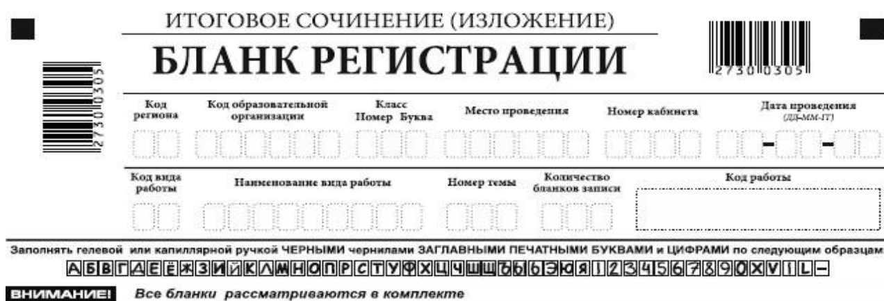
Рис. 2. Верхняя часть бланка регистрации

Бланк регистрации (рис. 1) состоит из трех частей: верхней, средней и нижней.