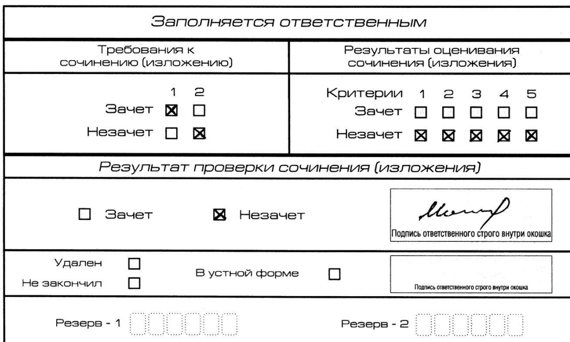
Рис. 9. Область для оценки работы

Если итоговое сочинение (изложение) соответствует требованию № 1 и требованию № 2, то выставляется «зачет» за выполнение требования № 1 и требования № 2. Указанные сочинения (изложения) далее оцениваются по критериям.