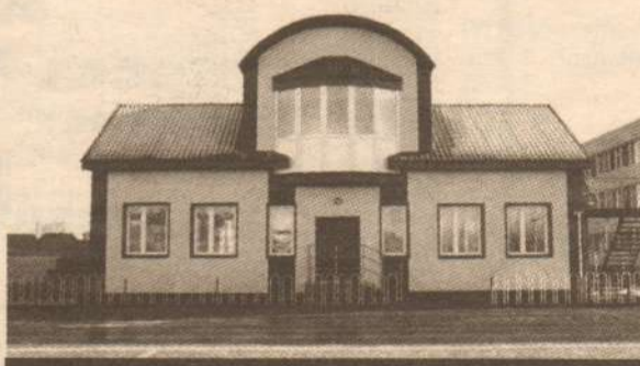
РАЗДЕВАЛКА ФОК «ОЛИМП»

На последнем совещании в администрации Лянтора было решено, что раздевалка, футбольное поле, теннисный корт, хоккейный корт, мини-футбольное поле, гимнастическая площадка, весь этот комплекс, «разбросанный» по городу, перейдет в распоряжение ДЮСШ. Но пока только готовятся документы на передачу, хотя ключи именно от раздевалки мы уже получили. Нам разрешили ей пользоваться на время морозов