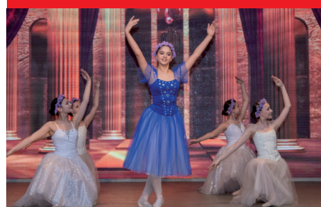
День работника культуры 2026