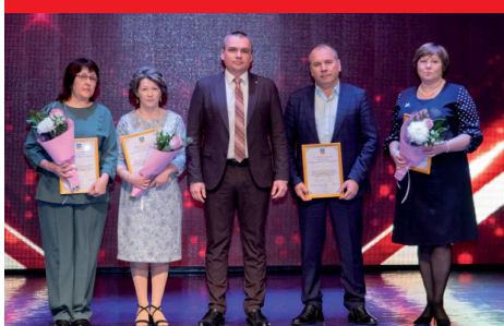
На фронте комфорта. Герои ЖКХ