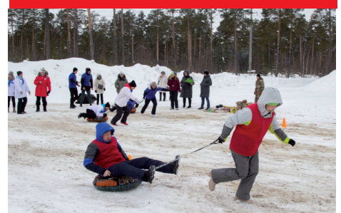
Праздник «Снежное многоборье»