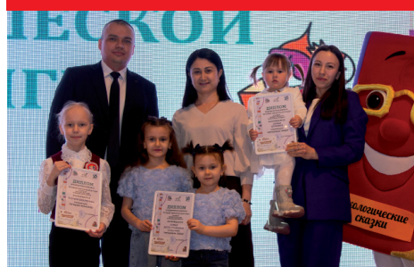
Открытие недели детской и юношеской книги