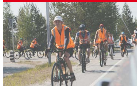
Велопробег Лянтор – Лямина