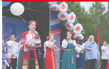
Празднование Дня России