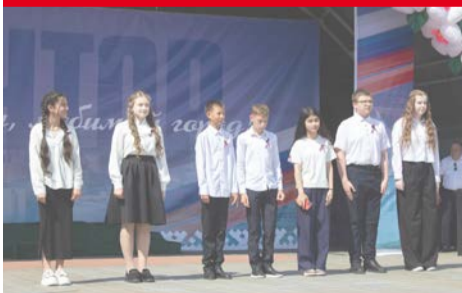
Торжественное вручение паспортов