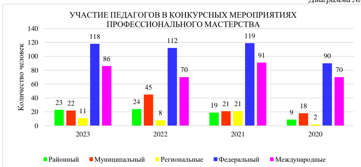
Диаграмма № 3

С 2020 года педагоги МАДОУ д/с «Солнечный круг» активно принимают участие в профессиональных конкурсах Минпросвещения России и при его поддержке.