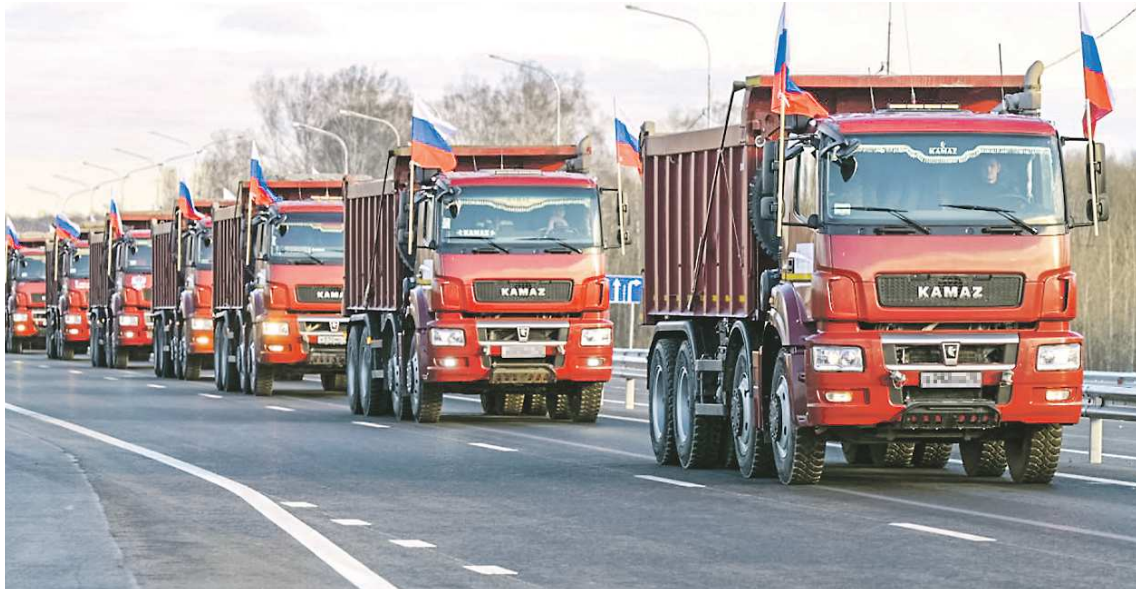
ДЕПАРТАМЕНТ ИНФОРМАТИКИ СВЕРДЛОВСКОЙ ОБЛАСТИ