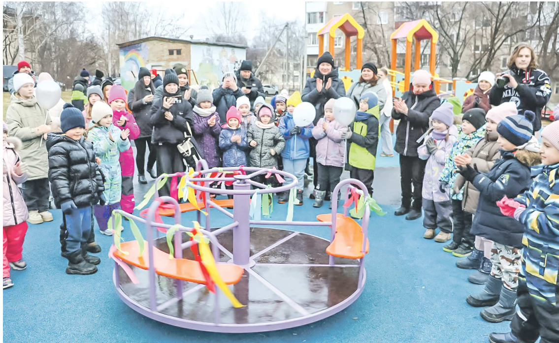
Для детей открытие площадки стало настоящим праздником

Проекты инициативного бюджетирования в Верхней Сал-