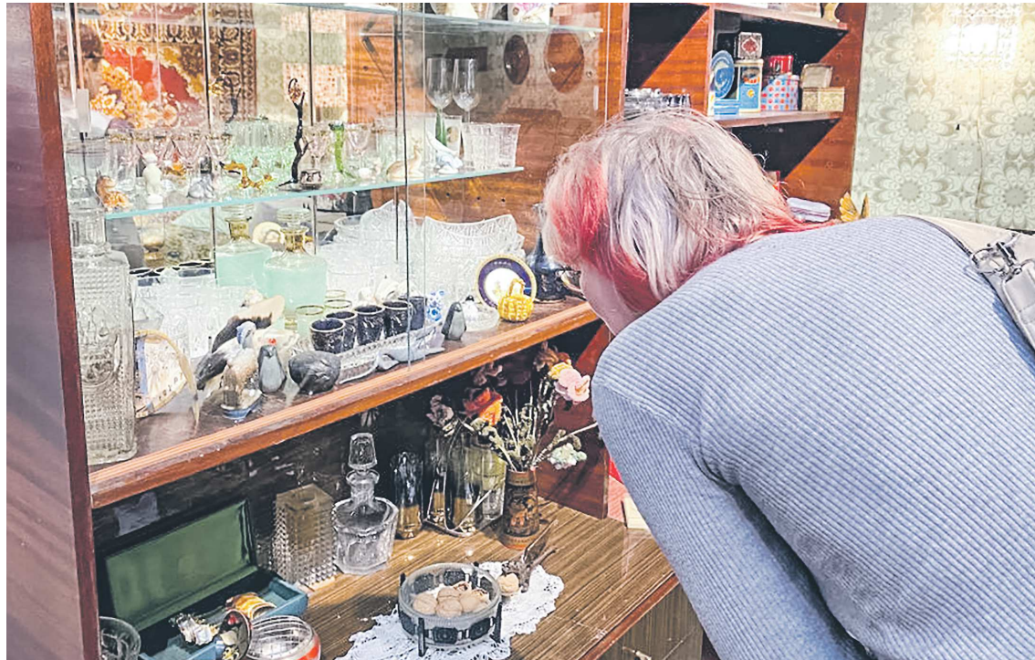
Заглянув в новый зал, гости музея будто оказываются в типичной советской квартире

В новом зале воссозданы атмосфера и уют типичной советской квартиры. Гости музея увидят знакомую многим мебель, детские игрушки, телевизор, транслирующий в черно-белом изображении, посуду и, конечно, тот самый ковер на стене – неотъемлемый атрибут интерьера тех лет. Каждый экспонат здесь – это живая история, рассказывающая о быте салдинцев. В музее отмечают, что экспозиция – это не просто собрание предметов, а мост между поколениями. Зал пользуется популярностью как у посетителей, с ностальгией вспоминающих молодость, так и у молодежи, которая наглядно может познакомиться с жизнью родителей, бабушек и дедушек.