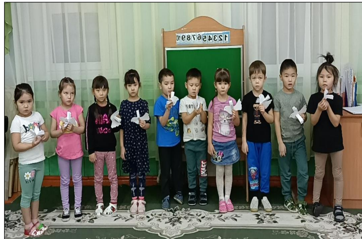
Интегрированное занятие «День Победы». Старшая группа, май 2025