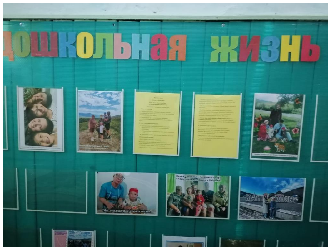
Фотовыставка «Семейные традиции», подготовительная группа, февраль 2025