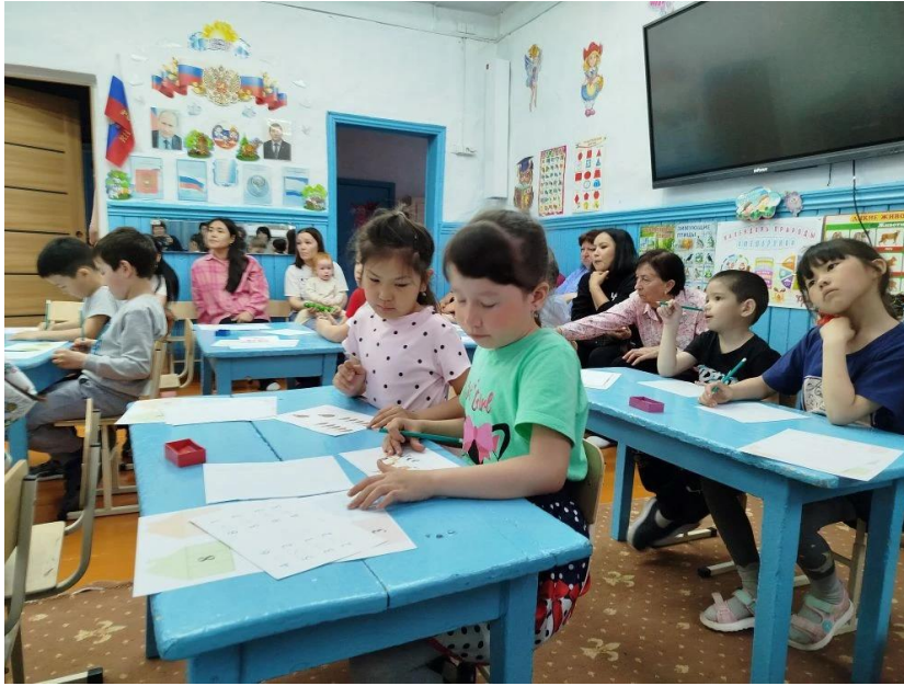
Фото открытых занятий