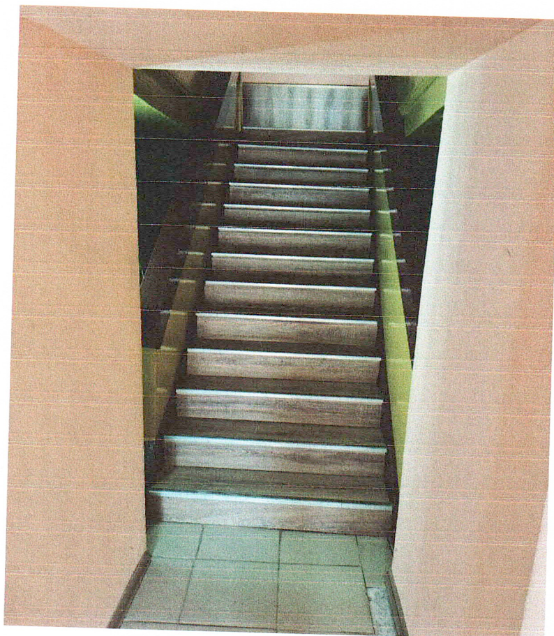
№ 6. Пути_эвакуации