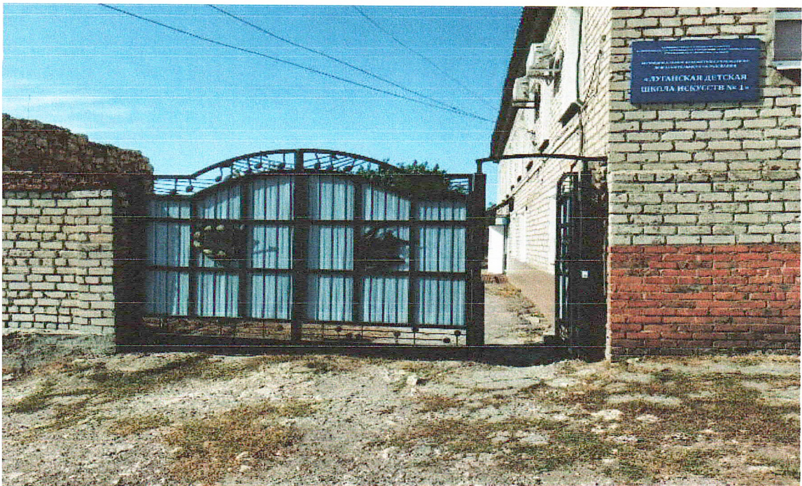
№ 2. Путь (пути) движения на территории