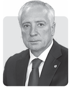
Владимир Мазур, губернатор Томской области

Научно-образовательный комплекс – это визитная карточка нашей области и одно из главных преимуществ региона. А томская наука – настоящий знак качества, который во все времена ценят в самых разных отраслях отечественной экономики и социальной сферы.