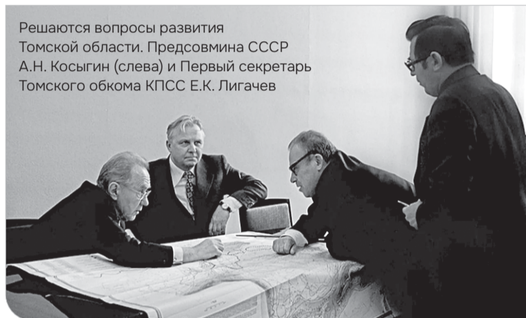
Решаются вопросы развития Томской области. Предсовмина СССР А.Н. Косыгин (слева) и Первый секретарь Томского обкома КПСС Е.К. Лигачев

В феврале в Томской домостроительной компании отмечают день рождения