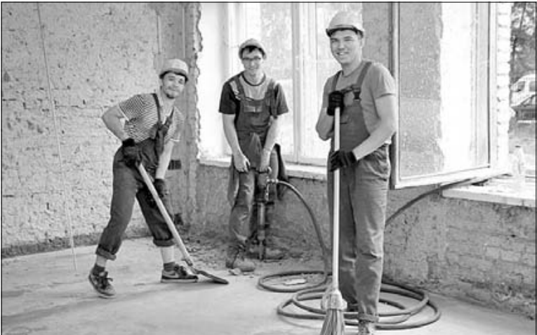
■ ССО «Феникс» трудится на ремонте средней школы № 15 г. Томска

Студотряды ТГАСУ показывают класс на главных стройках страны