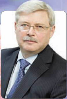
Сергей Жвачкин, губернатор Томской области