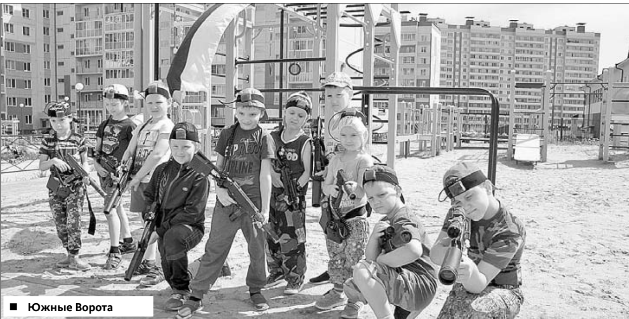
■ Южные Ворота

Теперь понятно, почему там, где остальным видится двутавровая балка, домостроители видят целый мир.