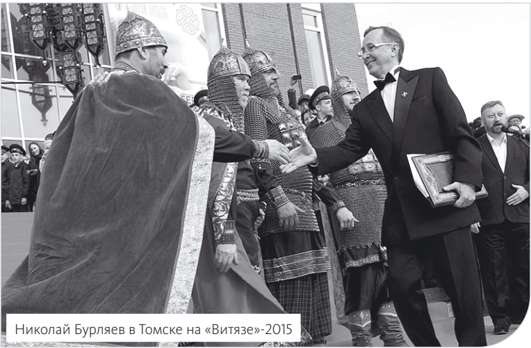
Николай Бурляев в Томске на «Витязе»-2015