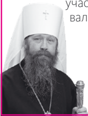
Ростислав, митрополит Томский и Асиновский

“Среди выдающихся личностей земли русской особое место занимает святой благоверный князь Александр Невский. Защищая русскую землю и отстаивая самобытность русского народа и независимость нашей Родины, он закладывал будущее величие нашего Отечества. Вполне логично, что молодёжный фестиваль визуальных искусств освящён именем великого подвижника нашей Родины. Хотел бы пожелать, чтобы представленные в рамках фестиваля фото- и видеоработы способствовали укреплению нашего Отечества, обретению молодёжью того духовно-нравственного стержня, которым всегда крепка была наша держава. Желаю помощи Божией и творческих успехов всем участникам фестиваля.”