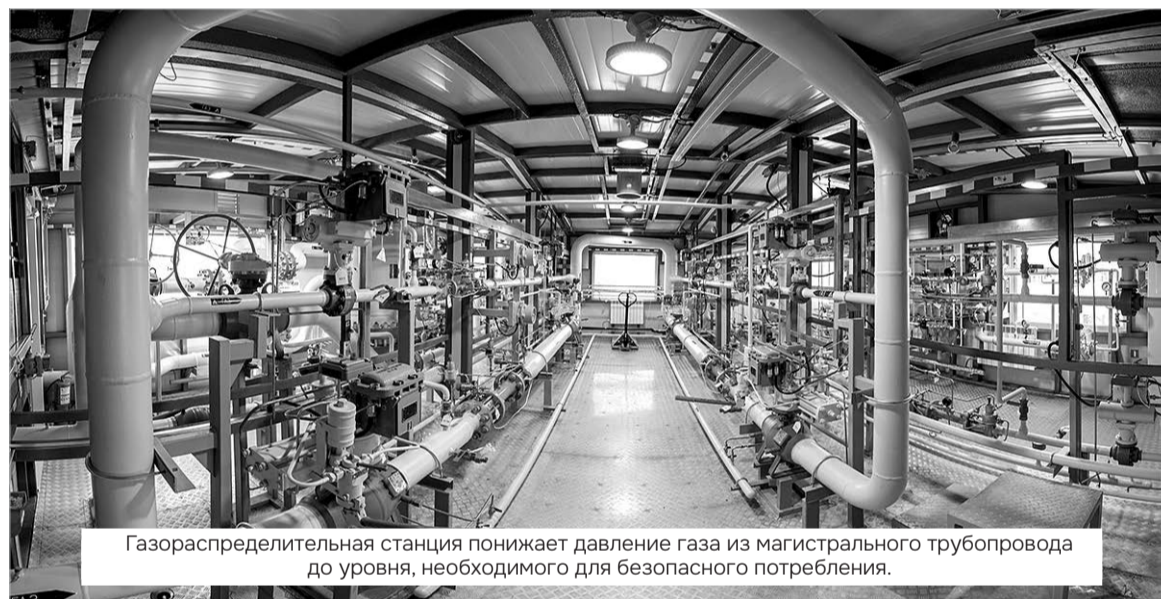
Газораспределительная станция понижает давление газа из магистрального трубопровода до уровня, необходимого для безопасного потребления.