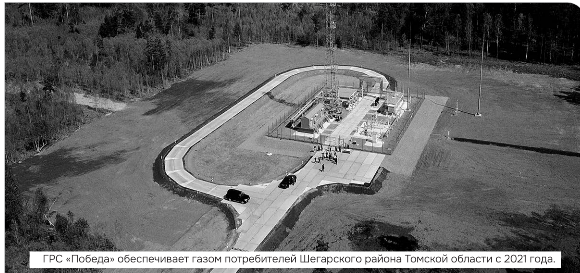
ГРС «Победа» обеспечивает газом потребителей Шегарского района Томской области с 2021 года.

Как «Газпром трансгаз Томск» развивает экономику и повышает качество жизни в регионах