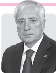
Владимир Мазур, губернатор Томской области

Уважаемые главы городов, районов, поселений, муниципальные депутаты и сотрудники администраций!