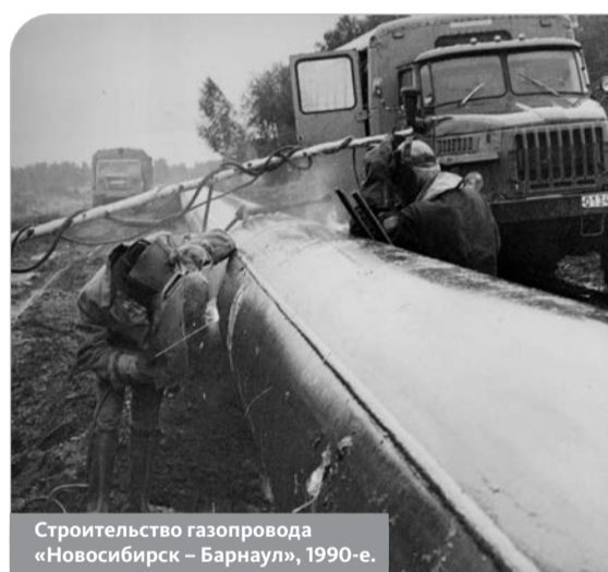
Строительство газопровода «Новосибирск – Барнаул», 1990-е.