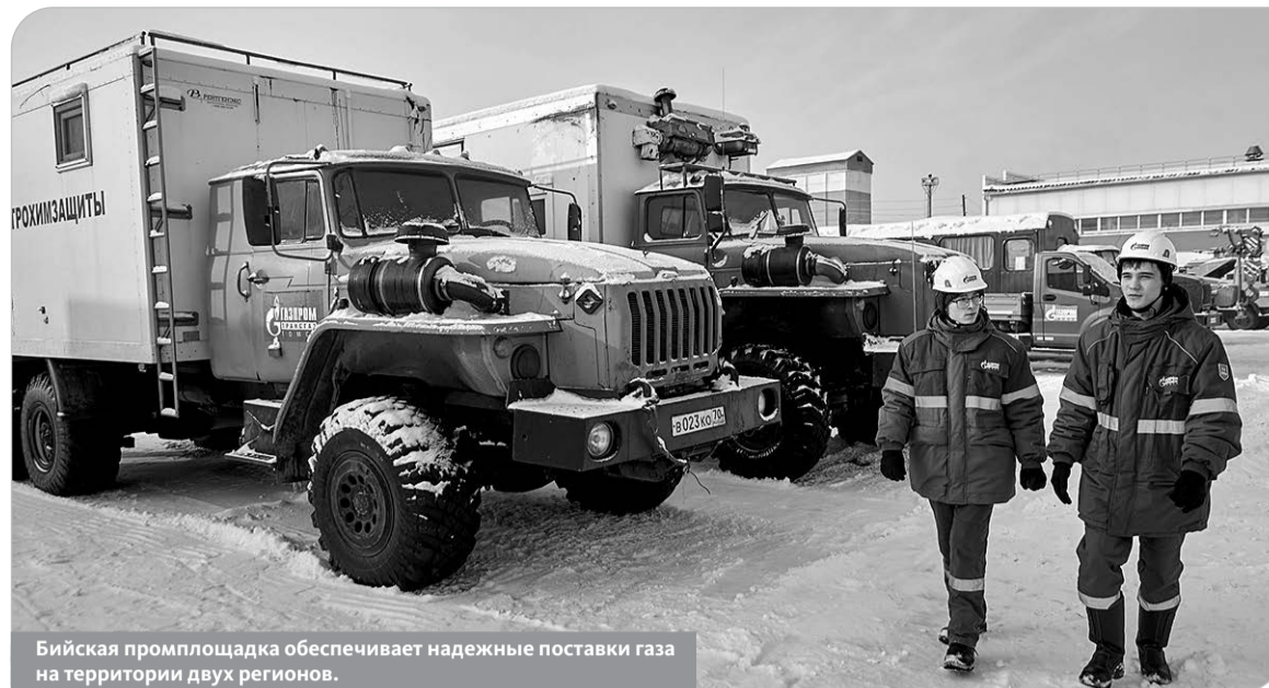
Бийская промплощадка обеспечивает надежные поставки газа на территории двух регионов.

В советский период Алтайский край жил обещаниями о том, что когда-то природный газ появится в их домах. С мертвой точки дело сдвинулось в 1991 году. В этот переломный для страны год стартовало проектирование, затем строительство магистрального газопровода и газораспределительных сетей.