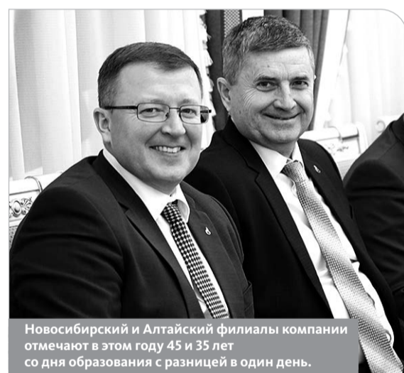
Новосибирский и Алтайский филиалы компании отмечают в этом году 45 и 35 лет со дня образования с разницей в один день.

Новое топливо принесло новые возможности для развития экономики. Крупнейшие потребители природного газа в Алтайском крае – предприятия энергетического комплекса, машиностроения и пищевой промышленности. – Недавно были большие морозы. Температура воздуха упа-