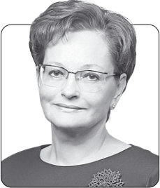
Оксана Козловская, председатель Законодательной думы Томской области