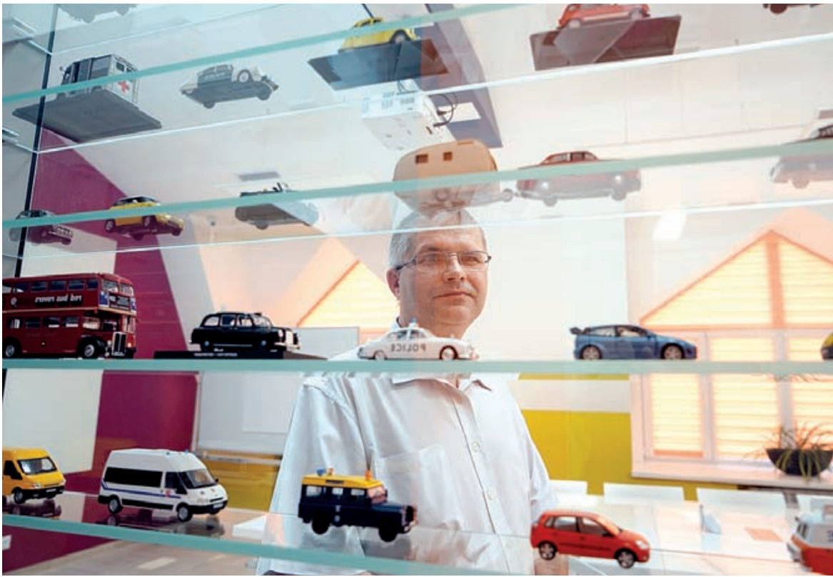
■ 389 автомобилей разных стран представлены в коллекции

Коллекционирование моделей автомобилей – удовольствие не из дешевых. Стоимость одной может колебаться от 600 рублей до нескольких тысяч. Все зависит от детализированности копии, производителя и тиража. Если это промышленный способ производства и количество экземпляров исчисляется сотнями и тысячами, цена будет демократичной. Если же за дело берется небольшая мастерская или индивидуальный мастер и только они выпускают конкретную модель автомобиля, стоимость может достигать до десятков тысяч рублей.