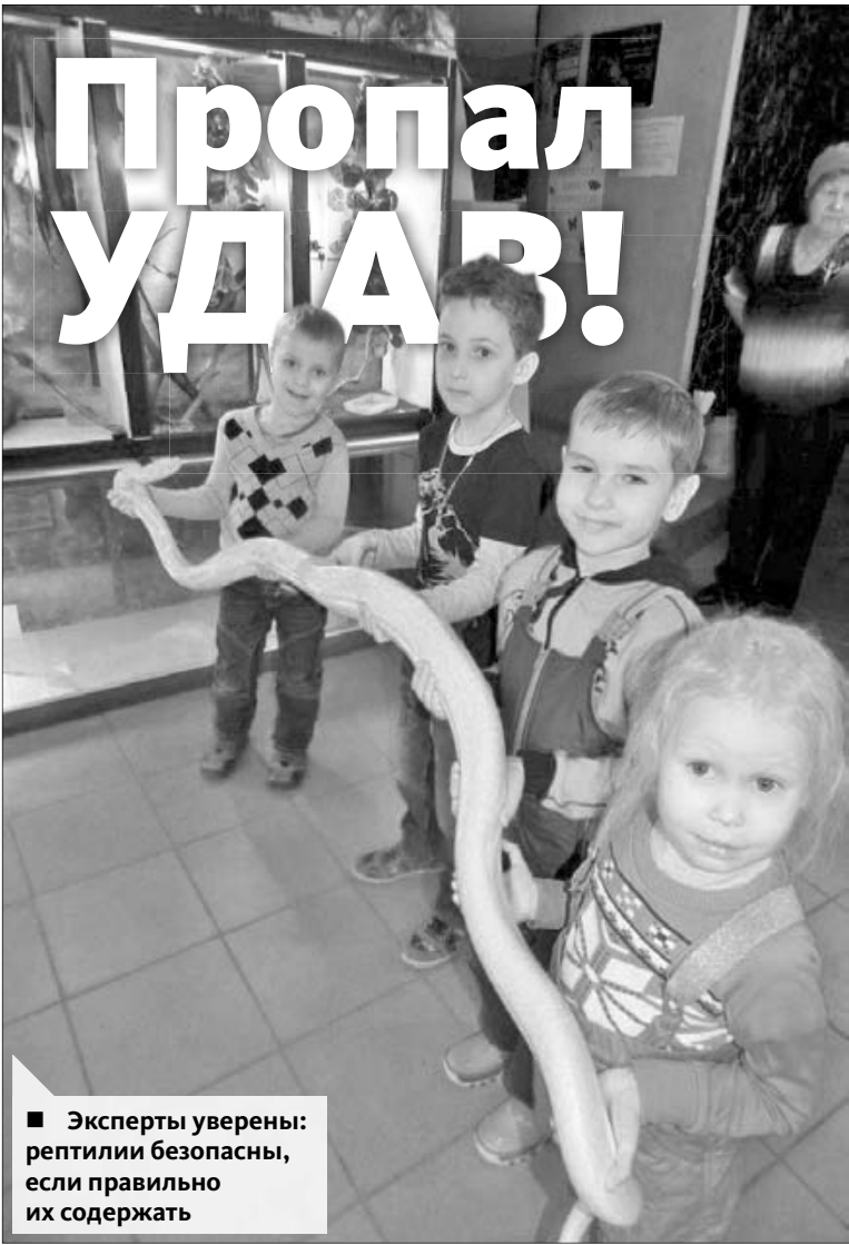
■ Эксперты уверены: рептилии безопасны, если правильно их содержать