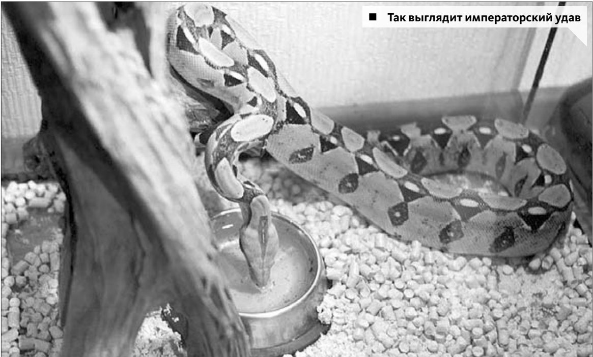
■ Так выглядит императорский удав

– Надо понимать, что потенциальная опасность исходит от