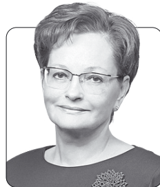
Оксана Козловская, председатель Законодательной думы Томской области