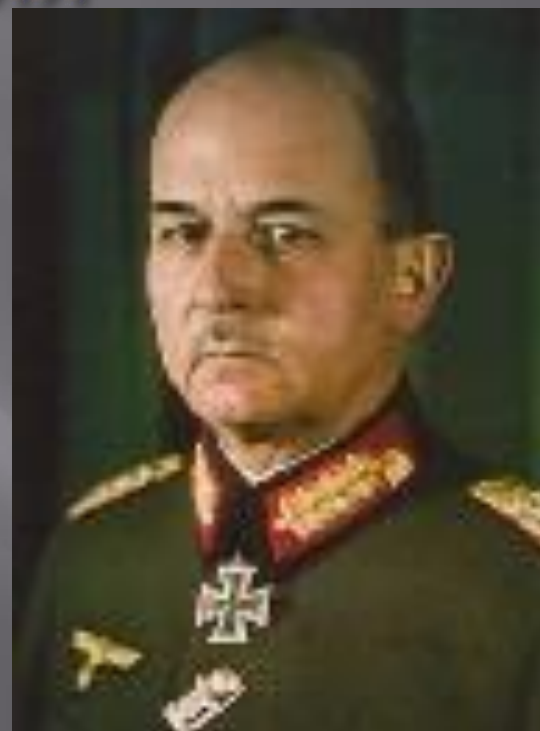
Группой армий «А» командовал генерал Фельдмаршал Вильгельм Лист