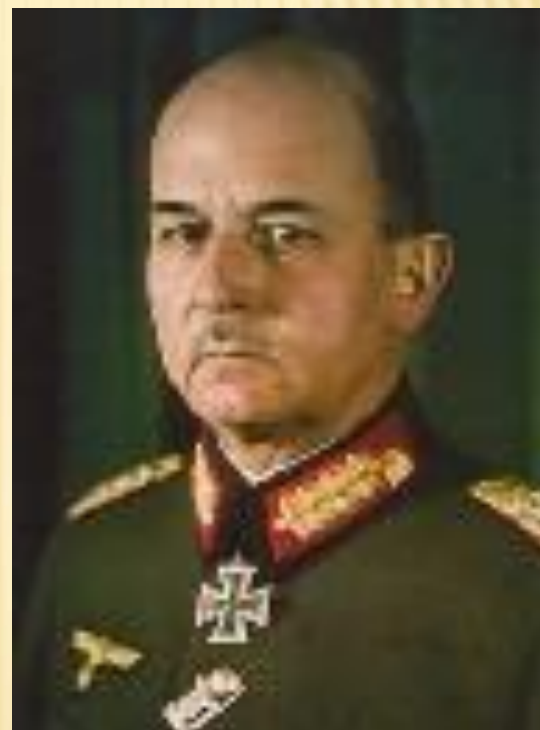
Группой армий «А» командовал генерал Фельдмаршал Вильгельм Лист