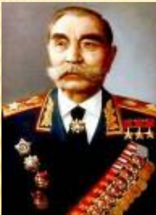
Войсками Северо-Кавказского фронта командовал С.М.Буденный