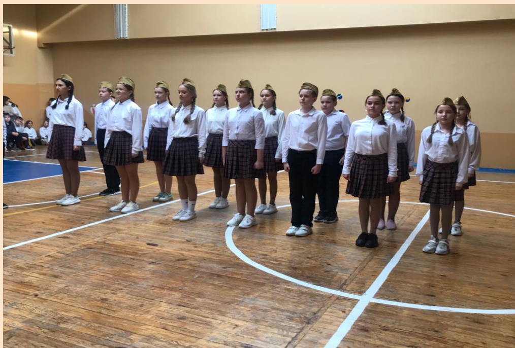
В полном составе пехотинцы 5 Г класса