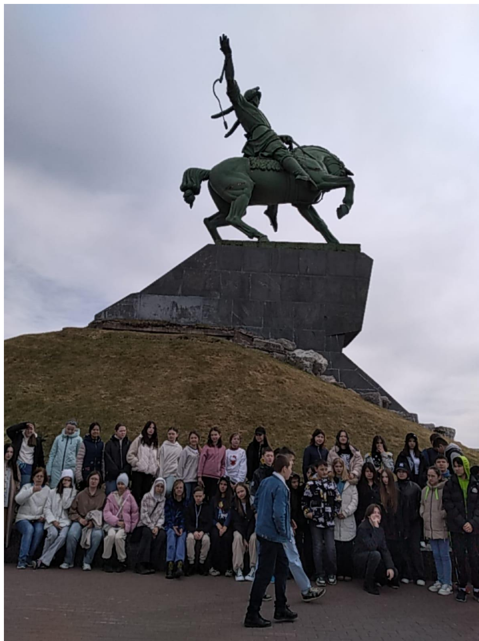
Памятник Салавату Юлаеву

Завершилось наше путешествие у памятника Салавату Юлаеву. Мы смогли полюбоваться произведением скульптура – монументалиста Сослан бека Тавасиева. Где бы мы ни были: в кафе или ресторане, парке или музее, гостинице или просто в автобусе, мы видели живое участие людей, реализующих этот уникальный проект. Хочется сказать большое спасибо за то, что нам представилась возможность увидеть частичку истории. Но, я думаю, Уфа таит ещё много загадок и мы туда снова вернёмся.