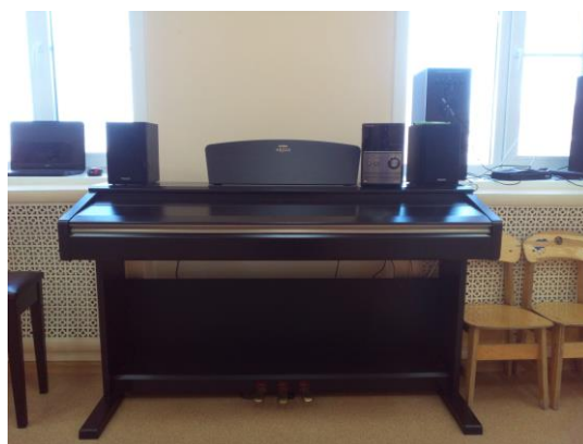
Фото музыкального зала и оборудования