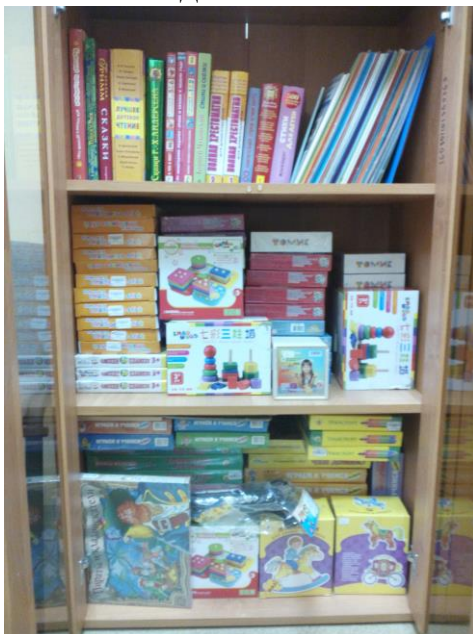
Фото методического кабинета