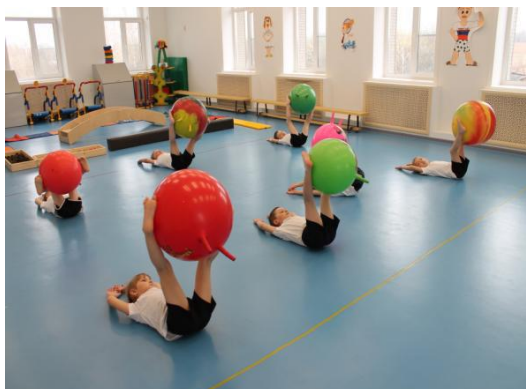
Фото физкультурного зала и некоторого оборудования