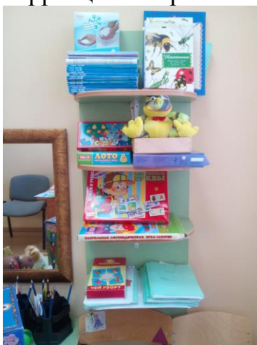
Фото оборудования в логопедическом кабинете

Для работы с детьми, нуждающимися в помощи педагога-психолога так же созданы все условия. В кабинете педагога-психолога имеется дидактический материал, развивающие, настольно-печатные игры в соответствии с возрастными особенностями детей, требованиями коррекционно-развивающих программ.