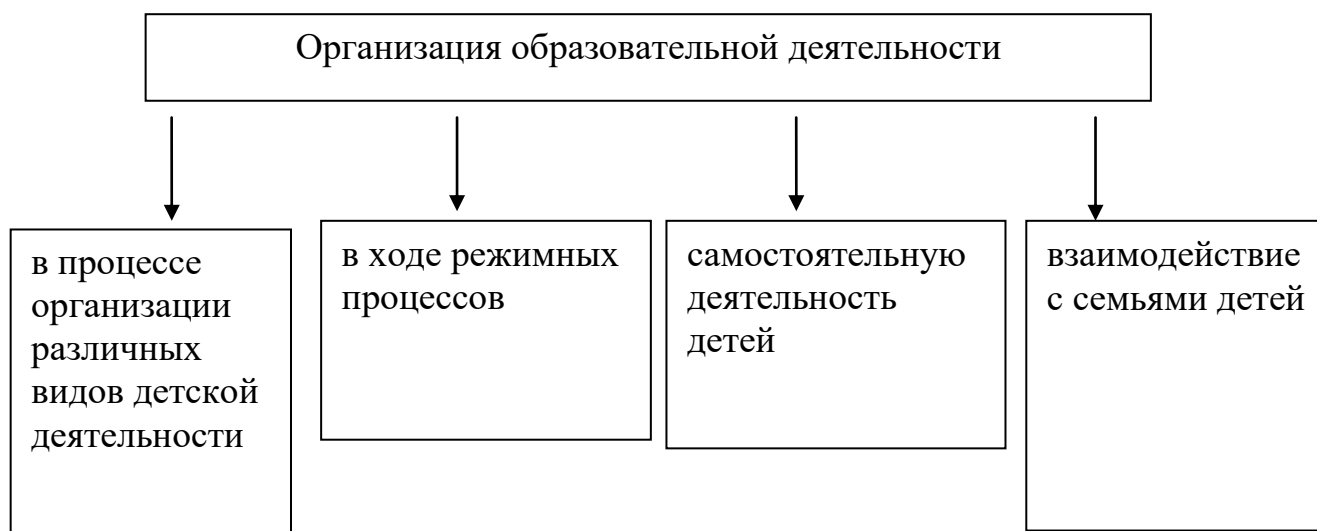
Схема Организация образовательной деятельности.