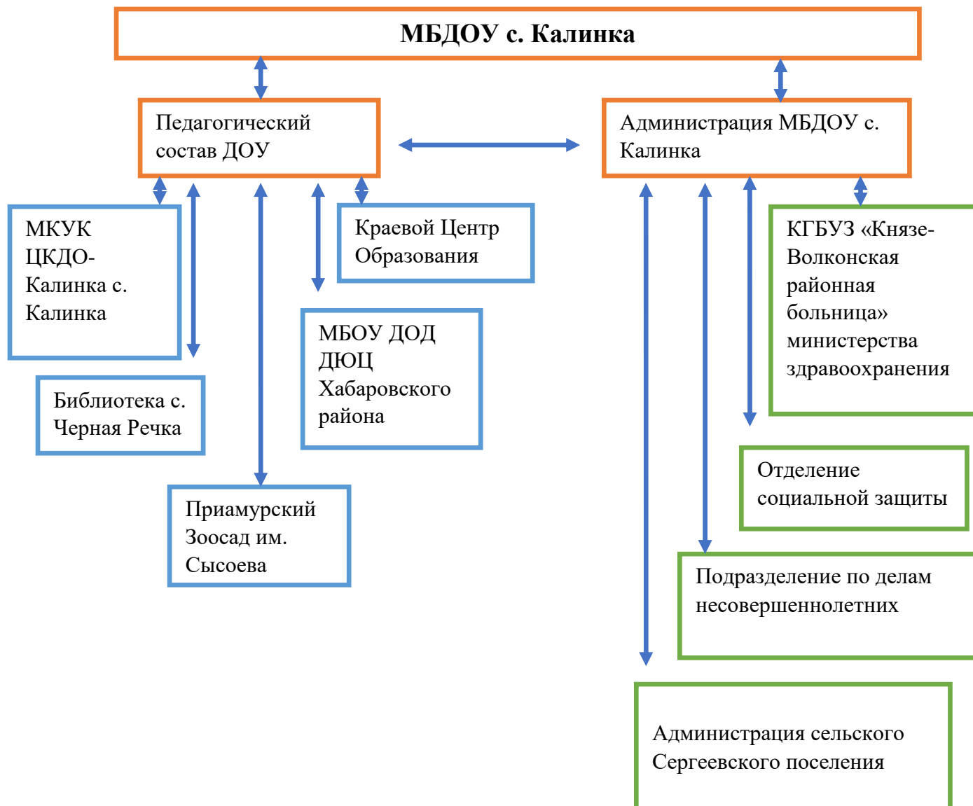
Схема 8 Сотрудничество МБДОУ с. Калинка с социальными партнерами

Я разрабатываю Программу профессионального развития, в которой указываю темы, формы и методы повышения своей компетенции в сфере воспитания, психолого-педагогического сопровождения обучающихся, в том числе с ОВЗ и других категорий.