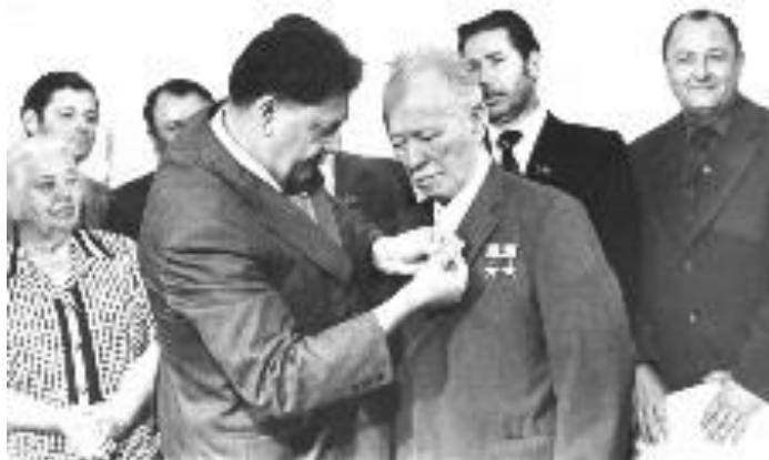
Шолохову вручают орден Ленина

В 1960 году писатель получил Ленинскую премию.