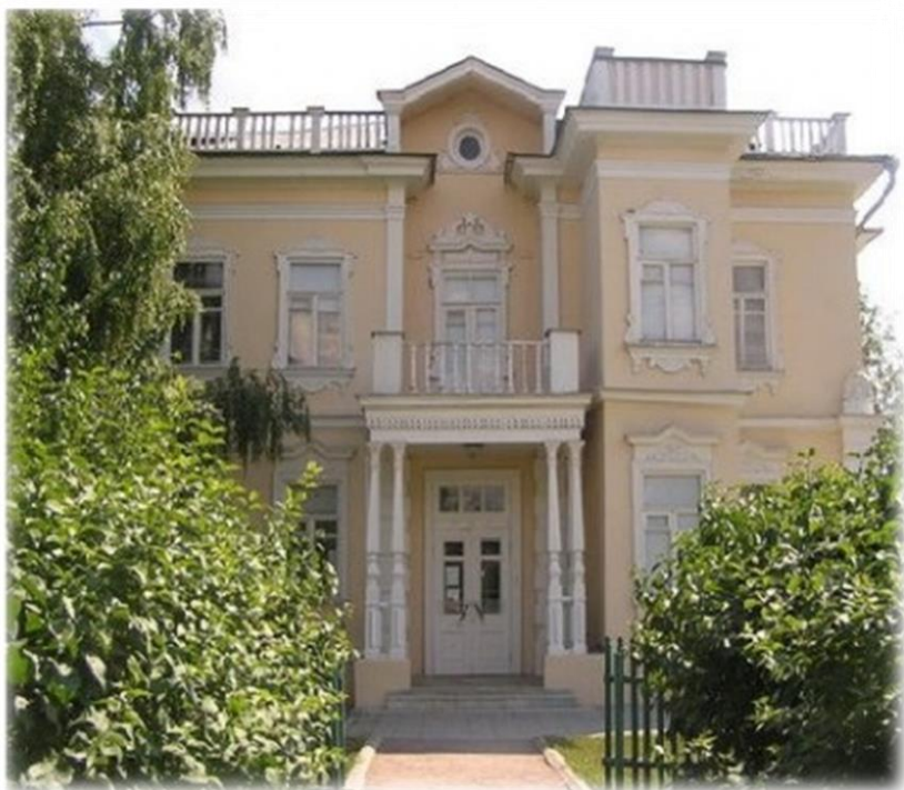
Дом-музей Шолохова в ст. Вёшенской

- В годы войны дом Шолоховых в Вёшенской был разрушен близким разрывом авиабомбы, погибла мать писателя. Михаил Александрович очень хотел восстановить старый дом, но повреждения были слишком серьёзными. Пришлось строить новый маленький домик, в котором жил Шолохов до самой смерти. Когда писатель умер, то его похоронили во дворе своего домика в станице Вёшенской, а не на кладбище.