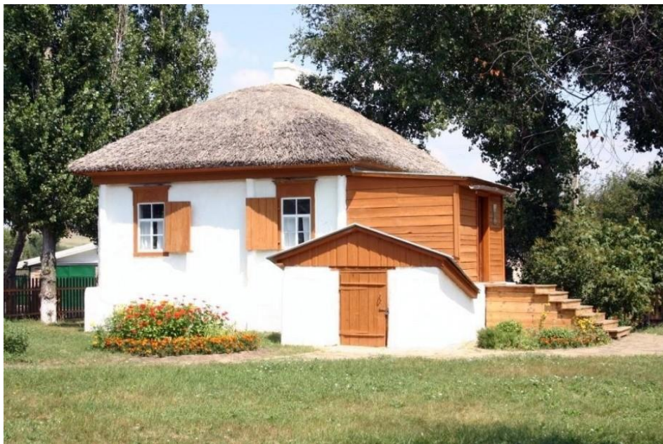
Дом, в котором родился Михаил Шолохов

Богучар. Приехав в Москву для продолжения образования и не поступив, вынужден был сменить множество рабочих специальностей, чтобы прокормиться. В тоже время в жизни Михаила Шолохова всегда находилось время для самообразования.