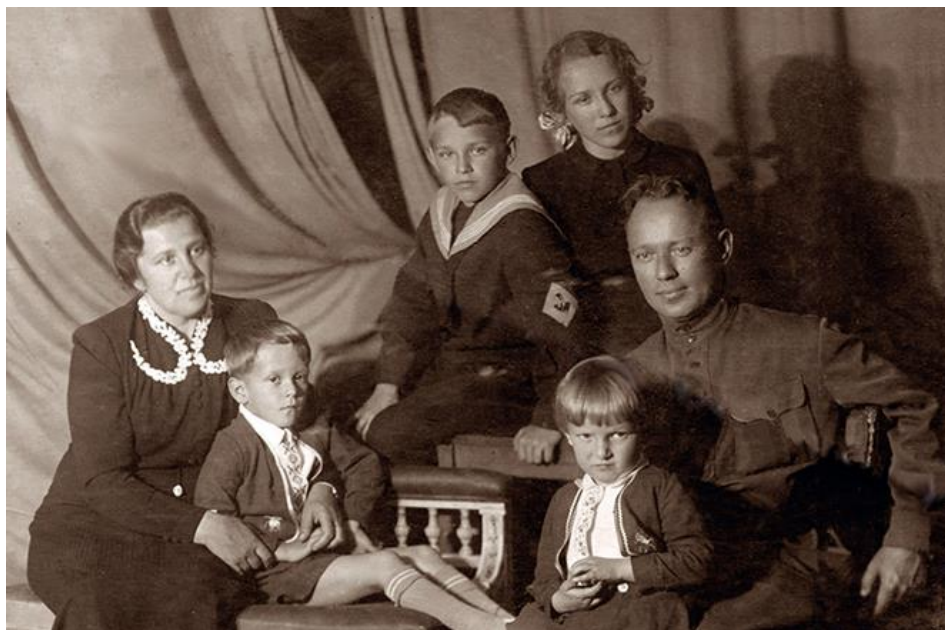
М.А. Шолохов с женой и детьми