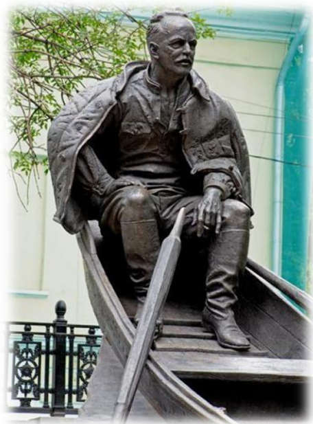
Памятник М.А. Шолохову в Москве

- В честь Михаила Шолохова названы сорт сирени, астероид и множество улиц по всей России.