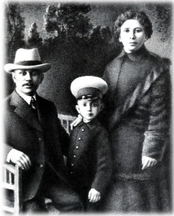
Михаил Шолохов с родителями

Михаил Александрович Шолохов родился 24 мая 1905 года на хуторе Кружилином, на Дону в Ростовской области.