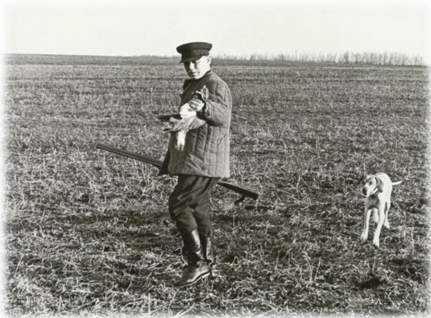
Шолохов на охоте

С 60-х годов Шолохов практически перестал заниматься литературой, любил уделять время охоте и рыбалке. Все свои награды писатель передал на благотворительность (постройку новых школ).