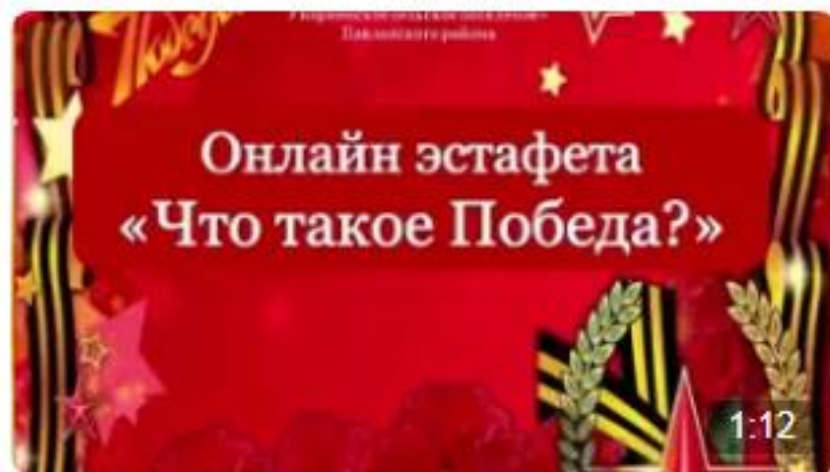
Онлайн эстафета «Что такое Победа» Мбу-Библиотека Мо-Упорненское-Сп

В нашей работе мы используем не только фото, но и видео формат проведения онлайн мероприятий.