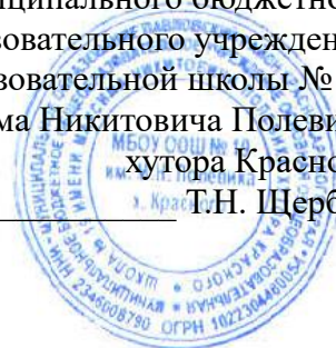
ГРАФИК питания обучающихся МБОУ ООШ № 19 им. М.Н. Полевика х. Красного на 1 полугодие 2023-2024 учебного года