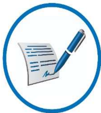
ЗАЯВЛЕНИЕ О ПРИЁМЕ В ВУЗ