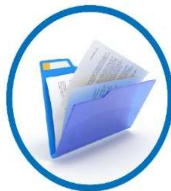
ДОКУМЕНТЫ, ПОДТВЕРЖДАЮЩИЕ ПРАВО НА ЛЬГОТНОЕ ОБУЧЕНИЕ