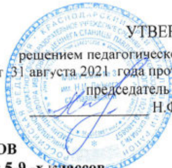
ТАБЛИЦА-СЕТКА ЧАСОВ плана внеурочной деятельности для 5-9 -х классов, реализующих федеральный государственный образовательный стандарт основного общего образования 2021 – 2022 учебный год